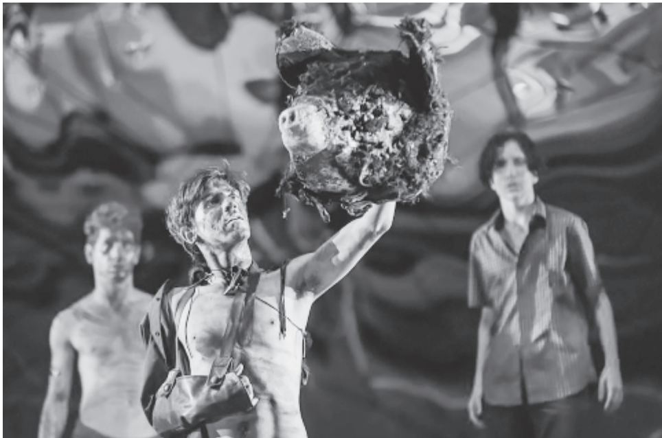
A legyek ura

A színház fenntartja a műsorváltoztatás jogát – áll az intézmény közleményében. ( Kn. )