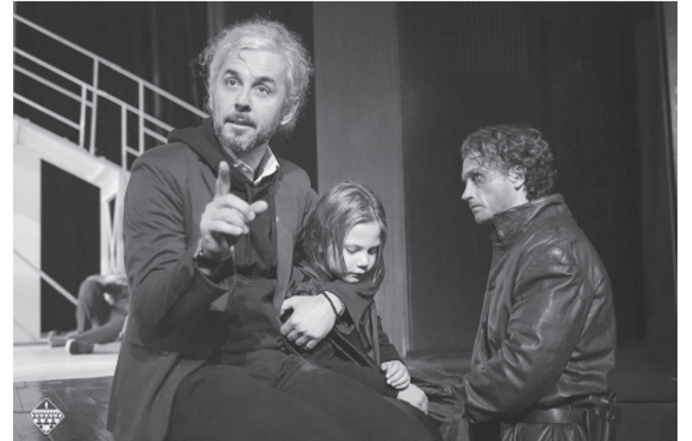
Egy lócsiszár virágvasárnapja