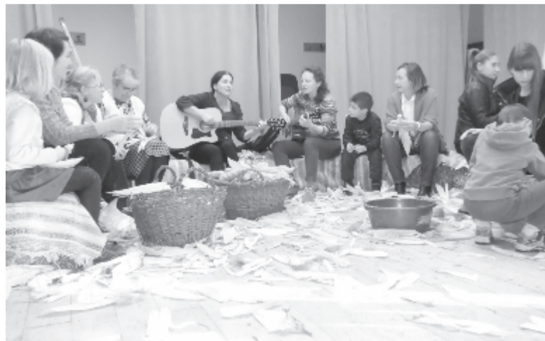
Gyerekek és szülők egyaránt jól szórakoztak, alkottak, énekeltek.