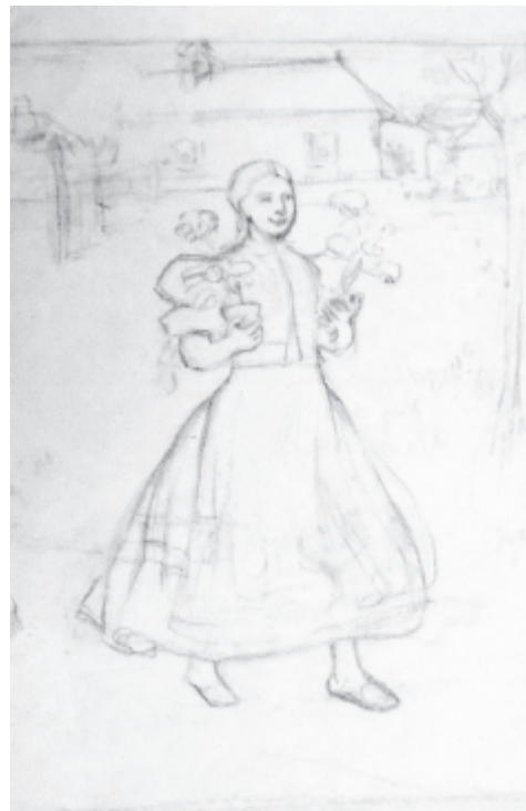
Lány virággal (ceruzarajz)

Milyen festményekre emlékszik a szülői házból? A kérdésre Ferenczy István elmondta, hogy a Lázár feltámasztása című kép volt rá a legnagyobb hatással. Szerette a matyó viseletről készült színes képeket, a virág- és különösen a muskátlis csendéleteket. Nagyon kedvelte a mediterrán világot ábrázoló festményeket, egy tájképet a legerősebb ökörcsordával, amit édesapja egy barátjának adott ajándékba. A nagymamáról