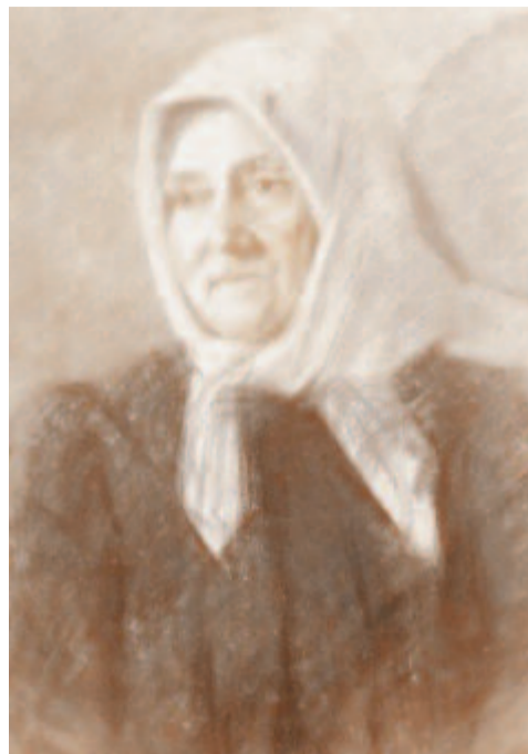
Feltételezhetően a festő édesanyjáról készült rajz