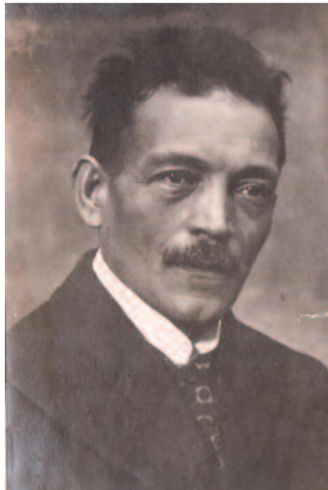
Ferenczy József fényképe