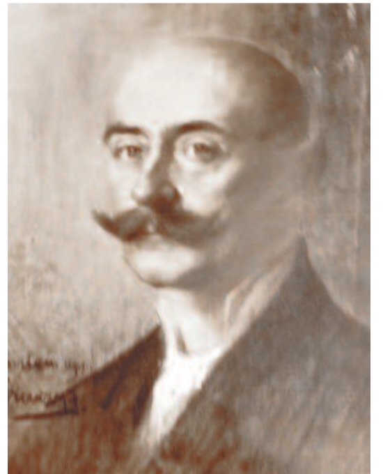
Rajz Gozdu Elekről

Hogy miért nem tért vissza szülővárosába, és miért választotta Temesvárt? A Bánság fővárosa a XX. század kezdetén gazdasági és művelődési szempontból is lendületesen fejlődő településnek számított, amelyről Ferenczy József azt gondolta: lehetővé teszi a festő számára, hogy művészetéből tudjon megélni. Ennek ellenére nem Temesvár, hanem egy brassói megrendelés (I. Ferenc Józsefet festette meg a brassói vármegyeház számára) indította el a siker útján. Műtermében, amely a temesvári belvárosi Csemeje-vits-házban nyitva állt minden érdeklődő előtt, az elkövetkező évek során egymás után kapta a megrendeléseket, elsősorban jeles emberek portréit festette meg. Urak és hölgyek mellképe készült el, politikusok, helyi méltóságok elevenedtek meg vásznain, amelyek idővel betöltötték a vármegyeháza és a városháza falait, és amelyekből sokat az 1919-ben visszavonuló szeb csapatok hurcoltak el. Időközben bibliai és történelmi témájú festményeken (Júdás, Az öreg honvéd álma) dolgozott, az utóbbi a Nemzeti Szalon