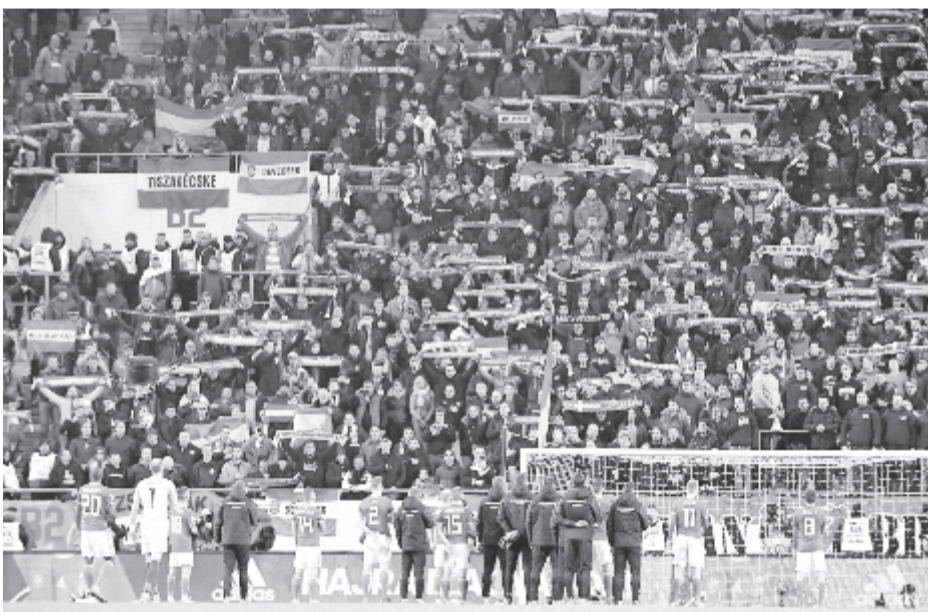
A győztes magyar válogatott játékosai köszöntik a szurkolókat a labdarúgó Nemzetek Ligája csoportkörének utolsó fordulójában játszott Magyarország – Finnország mérkőzés végén a budapesti Groupama Arénában 2018. november 18-án. Magyarország 2-0-ra győzött.

Marco Rossi szövetségi kapitány szerint a magyar labdarúgó-válogatott játékosai átértézték az utolsó két Nemzetek Ligája-mérkőzés fontosságát.