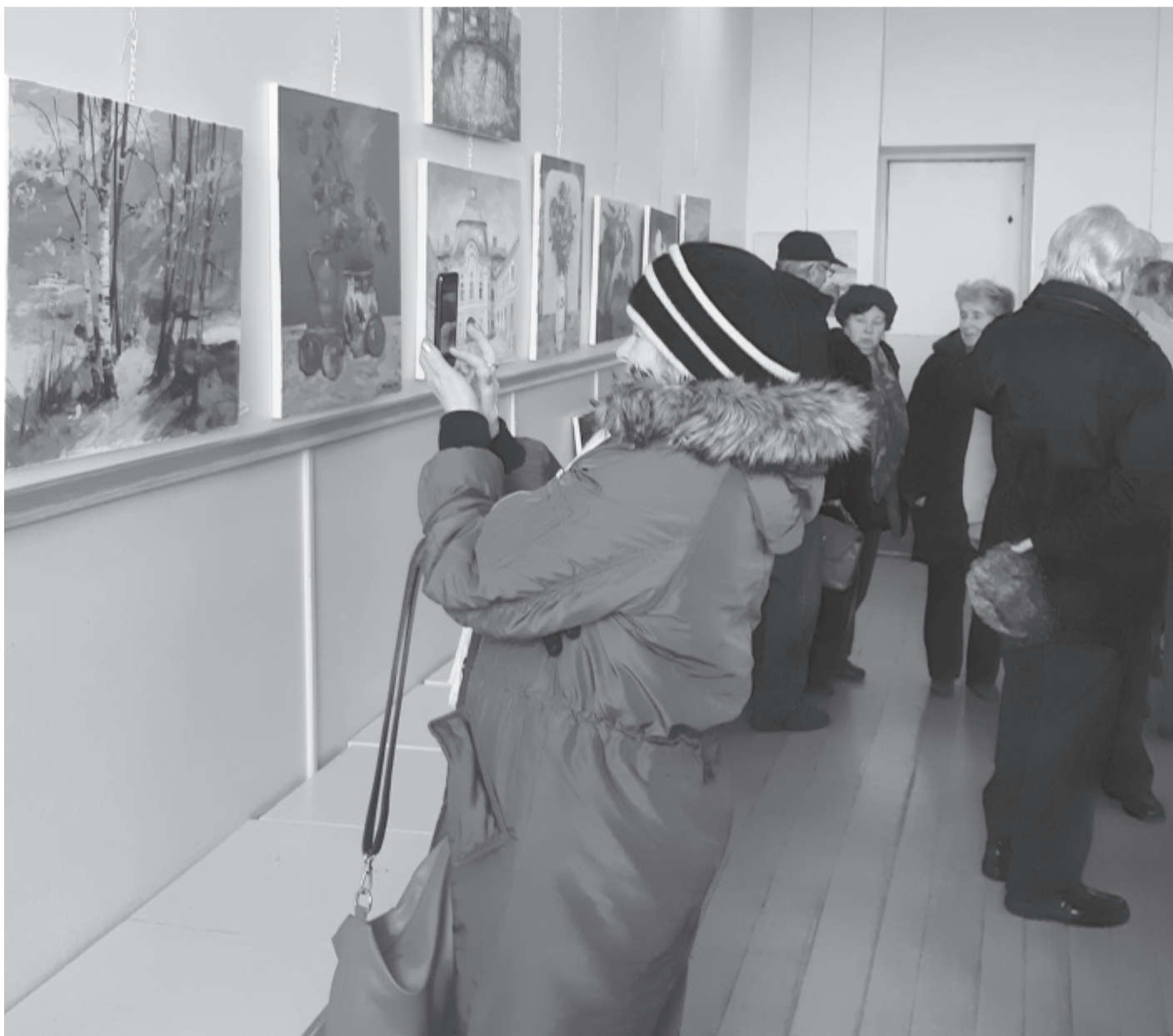
A Maros Megyei Képzőművészek Egyesületének marosvásárhelyi Unirea kiállítótermében a nagyenyrei alkotótábor festményeiből nyílt kiállítás

1922. január 3-án, 97 éve született a költő.