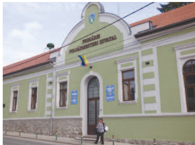
Szováton elkezdtek a városháza szakaszonkénti felújítását