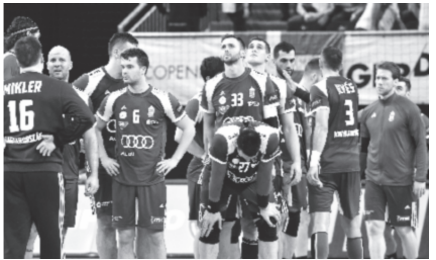
A magyar válogatott játékosai a német-dán közös rendezésű férfikézilabda-világbajnokság csoportkörének 1. fordulójában játszott Magyarország – Argentína mérkőzés végén Koppenhágában 2019. január 11-én. A találkozó 25-25-ös döntetlennel zárult.

A magyar válogatott szövetségi kapitányai közül Vladan Matić elmondta, nagyon nehéz, szoros meccsen vannak túl, de számítottak rá, hogy az argentinok nagyon gyors kézilabdát játszanak. Kapitánytársa, Csoknyai István kifejtette, hogy a védekezés és a támadás közötti hármas cseréből adódóan nem tudtak könnyű gólokat lőni, mindig csak felállt fal ellen küszködtek. „Volt, amikor könnyedén átjártuk őket, volt, amikor sok technikai hi-