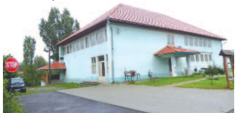
Magyaráson nekifogtak a kultúrotthon felújításának, de szerződésbontás miatt idén újakezdik az eljárást

Három nagyobb új beruházás várható 2019-ben a községben. Magyarországon teljesen felújítják az iskolaeépületet: megújul a tetőszerkezet, a fűtésrendszer, kicserélik a nyílászárókat, tűzjelző berendezést szerelnek. A beruházás értéke 2 millió lej. A torboszlói óvodánál 500 ezer lejből a kivitelező felújítja a tetőszerkezetet, központi fűtést szerel, kazánházat épít, belső mosdókat alakít ki, a 21. századi követelmé-