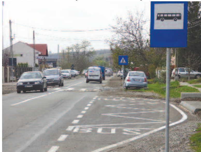
Jedden buszmegállókat épültek, a megyei utat szélesítik

A tavalyi év egyik legjelentősebb eredménye, hogy elkezdődött a Székelysárdtól Székelybőig vezető községi út korszerűsítése, és decemberre a 7,2 kilométeres szakaszból már csak 1,2 maradt aszfalt nélkül – a beruházást a fejlesztési