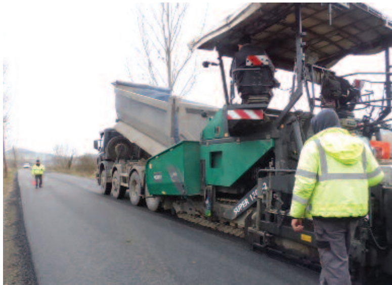
A szeredai önkormányzat számára a Sárd-Bő községi út aszfaltozása az egyik legnagyobb tavalyi eredmény

Az elmúlt hónapokban felújították a városháza egy részét, ezt az idén folytatják. Elkezdődött a Kisállomás utcában az új óvoda építése a Regionális Fejlesztési Minisztérium 8 millió lejes támogatásával, valamint elindítottak egy pályázati folyamatot a régi iskolaműhely fel-