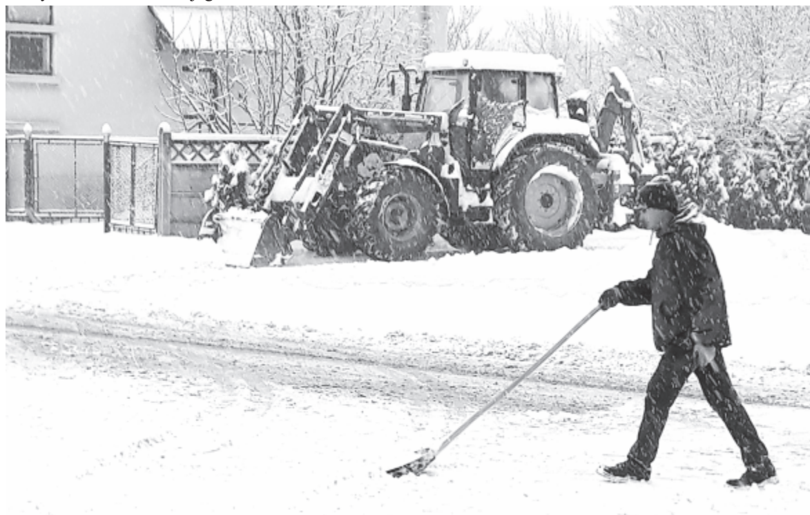
Ki lapáttal, ki géppel – a hó eltakarítását erőforrásaik szerint oldják meg az önkormányzatok

sebb havazás esetén a város központi részének eltakarítása élvez prioritást, azután a fűrdőtelepre, végül a peremrészekre jutnak el a munkagépek. Odafigyelnek az Illyésmezőbe vezető út takarítására is, mert az nehezen megközelíthető része a városnak. Ugyanakkor felkérték a lakosságot, hogy mindenki a lakása, telke előtti járdarészt takarítsa le, a vízelvezető árkokat tegye szabaddá, a háztetőről, ereszről, esőcsatornáról, erkélyekről távolítsa el a jeget. Aki