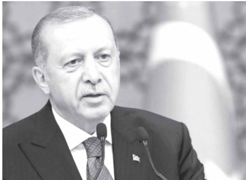
Recep Tayyip Erdogan

Erdogan múlt pénteken jelezte: várhatóan néhány hónapon belül létrejön az a nagyjából 30 kilométer széles biztonsági övezet a török-szíriai határ mentén, amelynek elgondolását Trump tűzte újból napirendre. A török elnök már akkor leszögezte: ha az ígélet ellenére, amelynek értelmében az övezet – mely Törökország védelmét szolgálná a Népvédelmi Egységek (YPG) szíriai kurd milíciával szemben – mégsem jönne létre, Ankara maga alakítja azt ki.