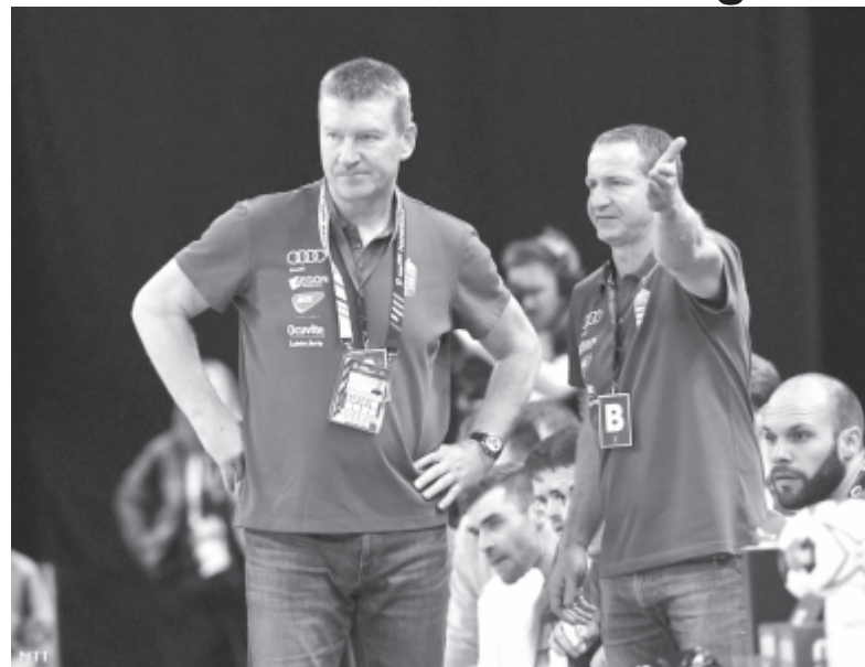
Rendhagyó módon két szövetségi kapitány – Csoknyai István és Vladan Matics (j) – irányította a magyar válogatottat a Dániában és Németországban rendezett férfi kézilabda-világbajnokságon.

„Nem bántam meg, hogy elvállaltam a szövetségi kapitányi posztot, mindent meg tettem, amit tudtam. A tizedik hely a reális kép” – mondta Vladan Matics, a vasárnap véget ért világbajnokságon a minimális célkitűzéstől, vagyis a hetedik helytől elmaradó magyar férfi kézilabda-válogatott szövetségi kapitánya a Digi Sport tegnapi műsorában.