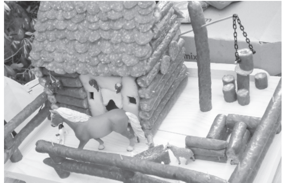
Még kolbászház is készült asztaldíszként