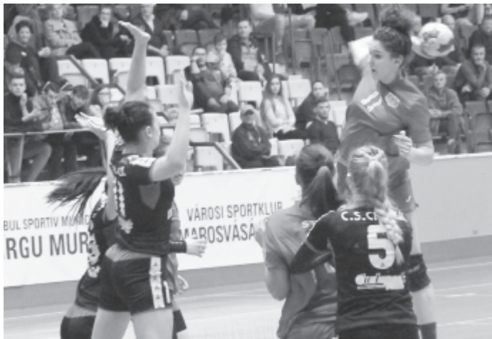
Egy a marosvásárhelyi támadások közül: a Köröskisjenő elleni mérkőzést már az első félidőben eldöntötte a hazai csapat, amikor nyolcgólos előnyre tett szert.

A Köröskisjenő elleni mérkőzést már az első félidőben eldöntötte a hazai csapat, amikor az agresszív és pontos védekezésnek köszönhetően csupán 11 gólt kapott, és nyolc gól előnnyel mehetett pihenni a szünetben. A második félidőben