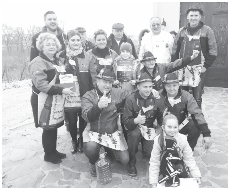
A Hurkás Pingvinek töltötte a legfinomabb kolbászt

lást: a Pingvinek és a Clearbász pulisztkával, a Fidel Gastro brokkolis krumplipürével, pecsenyelével és hagymalekvárral tálalta a kolbászt, savanyúságnak céklát, tormát, savanyú káposztát és uborkát, káposztával töltött paprikát tettek az asztalra. A Clearbász egyedi díszítéssel is jelentkezett: kolbászból épített házat és udvart, és még a kerítés és kútgém is kolbászból volt, csupán egyik házfalba építettek bele szalonnát is.