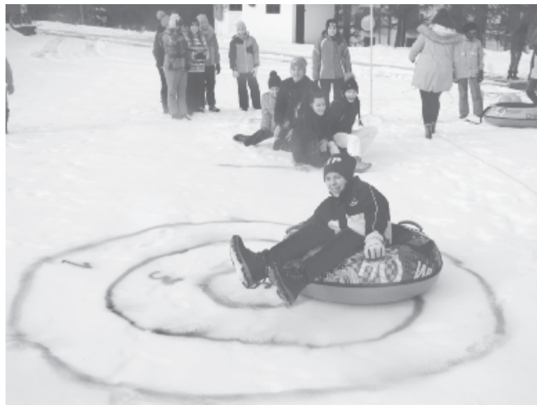
Érdekes játékok sokasága várta a gyerekeket

A felnőttek is jól érezték magukat: miközben gyerekeik a próbákon ügyeskedtek, ők hóemberépítéssel szórakoztak, majd innivaló mellett beszéltek meg a teljesítményeket.