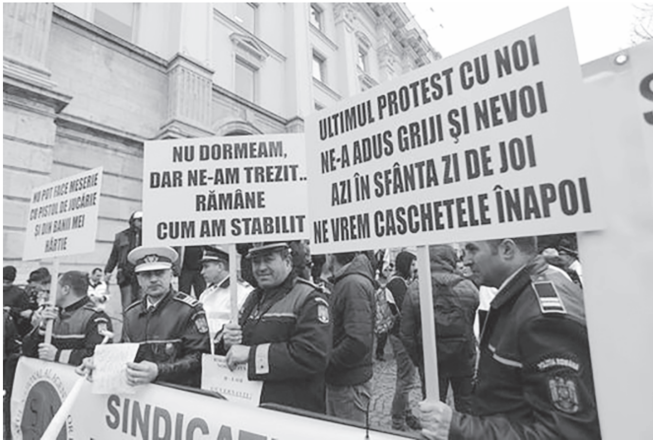
2017-ben is magasabb bérekért tüntettek Bukarestben a rendőrök