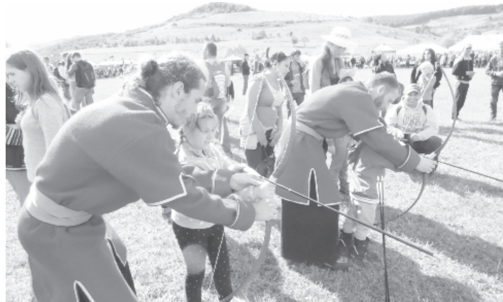
Családi városnapot, lovas és közösségi programokat ígérnek a szervezők