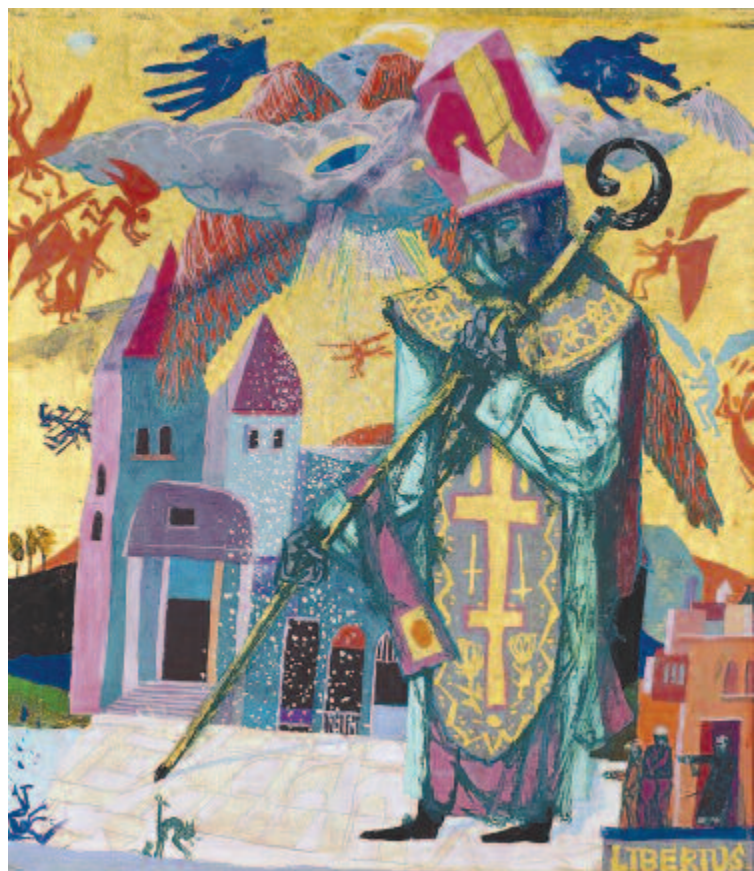
Kondor Béla: Liberius (1965)

Mind a négy lapszám vége felé könyvismertető hívják fel az olvasó figyelmét a székelyudvarhelyi kiadó – Erdélyi Gondolat Könyvkiadó, Székely Útkereső Kiadványok, Székelykapu Könyvkiadó, Erdélyi Pegazus Könyvkiadó – műhelyében született művekre, a gazdag ismertetőanyag Regéczy Szabina Perle tollából származik. A tavalyi negyedik Toll azonban a korábbi háromtól eltérően nem recenziókkal, hanem Ráduly János Dedikációk könyve című, dokumentumértékű munkájának részletével zárul, pontosabban ez az utolsó előtti izgalmas böngészőoldal, a leghátsó oldalakon ugyanis az Erdélyi Toll – Erdélyi Gondolat Kiadó kiadványainak világhálós elérhetőségei találhatók meg.