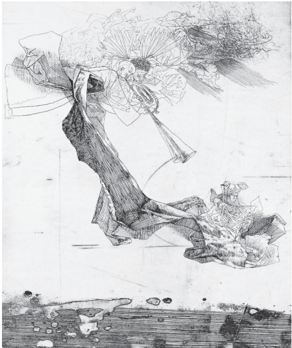
Kondor Béla: Két angyal (1969). 88 éve, 1931. február 17-én született a kétszeres Munkácsy-díjas festőművész, grafikus, költő (elhunyt 1972. decemberében)

89 éve, 1930. február 3-án született a Kossuth-nagydíjas költő, a nemzet művésze