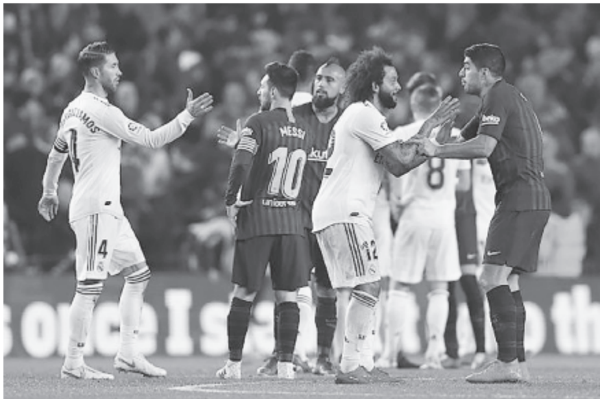
A Barcelona – Real Madrid Spanyol Kupa-elődöntő első mérkőzésének végén készült ez a felvétel, amelyet a Waar Media tett közzé