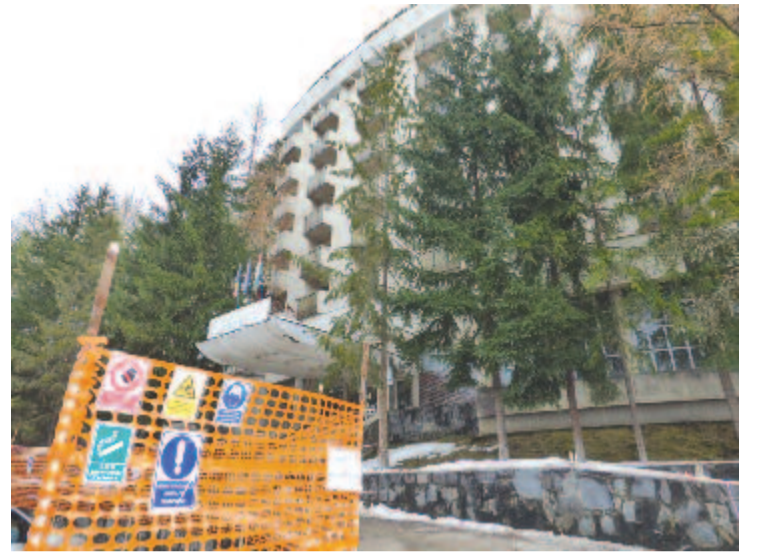
Tavaly év végén elkezdődött az épület felújítása és bővítése, amit idén decemberig be is fejeznék

Az újabb beruházás nemcsak az eddigi minőség miatt vált időszerré, a gazdasági mutatók is