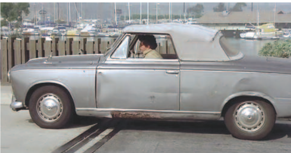
Columbo hadnagy legendás kabriója

A hatvanas évek végén Sergio Pininfarina formatervezővel karöltve született meg a 403-as széria, amelyet a kultikus sorozatszerelő, Columbo hadnagy is vezetett. 1976-ban a cég egyesült a szintén francia Citroën autógyártó céggel, ekkor alakult meg a PSA-csoport, amely később összefogott az Opel-lel, a Fiattal meg a Toyotával, és egy időre motorszállítóként a Forma-1-be is beszállt. (MTI)