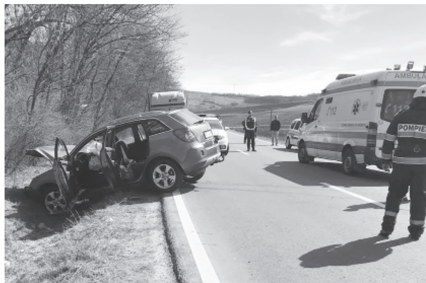
A Radnót–Dicsőszentmárton útvonalon, a Bábahalmi út kereszteződésében tegnap két személyautó ütközött, a balesetnek hét sérültje volt, mindannyiukat a marosvásárhelyi sürgősségi ügyeletre szállították. A hasonló baleseteknél való közbelépési időt rövidítheti le számottevően az új munkapont.

A város zsúfolt forgalma miatt született az új munkapont, annak érdekében, hogy azt az övezetet kiszolgálják, illetve a város nyugati feléből érkező riasztásokhoz időben kiérjenek. Amint Virag Cristian szövegíró elmondta, az egységnek állandó SMURD sürgősségi mobilügylete lesz, B2 típusú mentőautóval, ezt követően egy tűzoltócsoporthoz is szolgál majd, mindenképp előtt a városnak a kombinát felőli övezetében és a szomszédos települé-