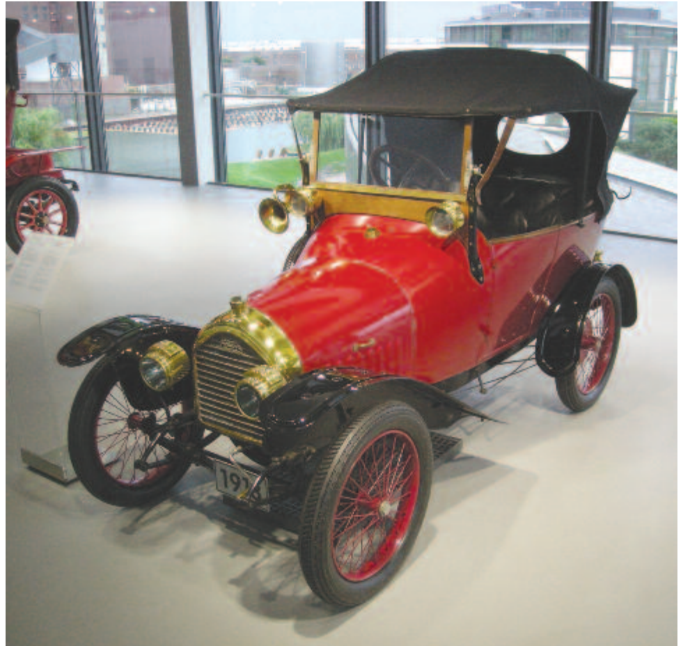
Egy Peugeot Bébé 1913-ból

Unokatestvére, Eugène nem osztotta újszerű elképzeléseit, ezért Armand 1896-ban Lille-ben Societe Anonyme Des Automobi-