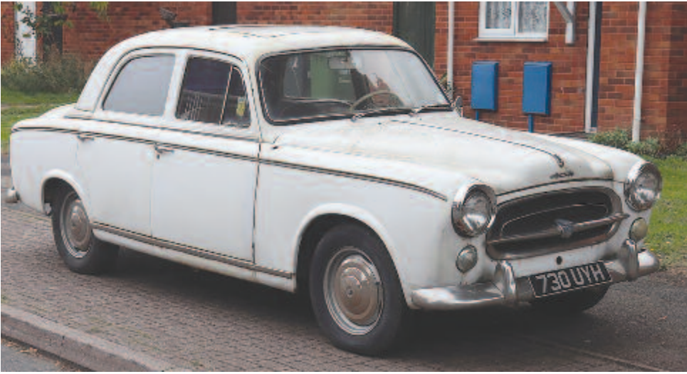
A Peugeot 403 limuzinvaltozata