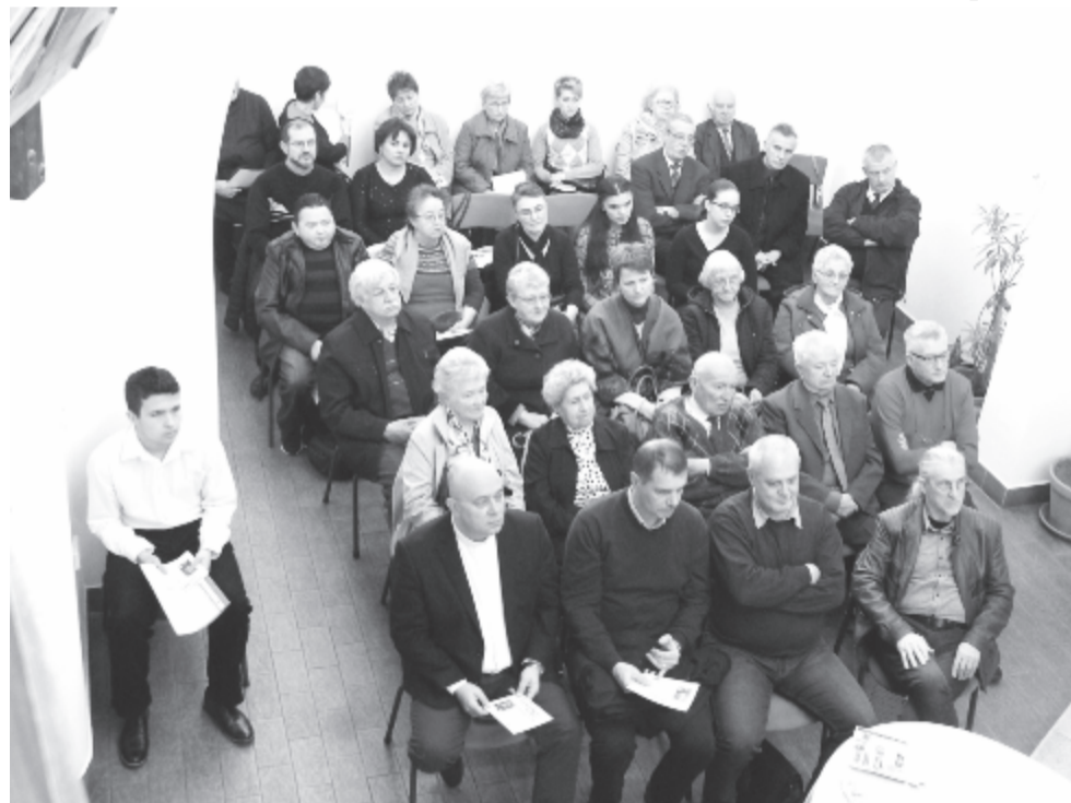
(Folytatás az 1. oldalról)

és a szerkesztők gondolatait idézve szólt a kezdeti lépésekről, majd betekínthettünk a lap történetének mozzanataiba. Hallhattuk, hogy az idők során miként csatlakoztak többen a szerkesztők köréhez, hogyan szélesedett ki a lap tartalma, kínálata, s arról is beszámolt, hogy a piacgazdálkodás kegyetlen világában miként küzdöttek a fennmaradásért. Hogy 20 éve léteznek, és a közösséget szolgálják, több olyan helyi értelmiséginek is köszönhető, akik a mai napig szívügyüknek tekintik fenntartani a lapot, cikkeikkel jelentkezni, véleményt formálni, egyszerűen vállalni azt a közösségi életet, amely összetartó erőként hat a város magyarságának életében. Többen voltak olyanok, akik a 20 év alatt nemcsak a lap, hanem a város magyarságának az életében is meghatározó szerepet vállaltak a maguk szakterületén, tanárként, politikusként, vállalkozóként, képzőművészként, vagy egyszerűen a közélet iránt érdek-