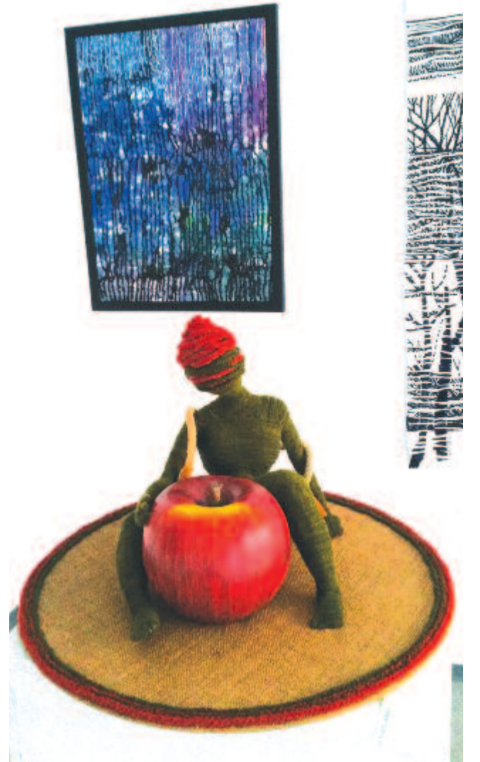
A 22. Ariadne kiállítás egyik részlete