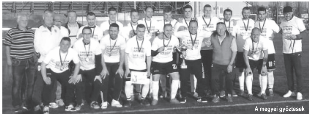
A megyei győztesek