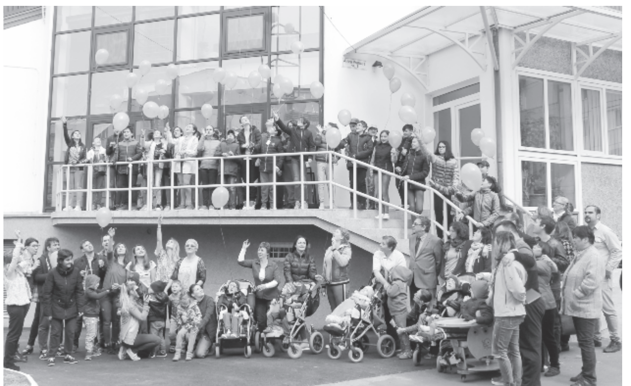
Kék léggömbök vitték a hírt a magasba, hogy Marosvásárhelyen az Alpha Transilvaná Alapítvány Kitarítás Központjában is megemlékeztek az autizmus világnapjáról. Este a polgármesteri hivatal épületét „öltöztették” kék fénybe.