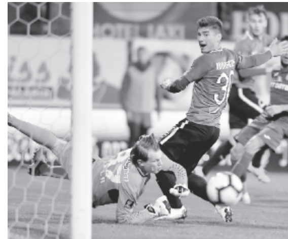
A következő fociévad első serlegét július 6-án ítélik oda: a Szuperkupáért a bajnok Kolozsvári CFR és a kupagyőztes Konstancai Viitorul Ploiești-en mérkőzik meg.

A 3. ligában egyébként az idén is öt csoportot alakítanak ki, egyenként 16 csapattal. Egyelőre a szászrégeni Avântul indulása a biztos. A Marosvásárhelyi MSE jelezte a szövetségnek, hogy amennyiben marad szabad hely, akkor érdekelt az indulásban, és nagy valószínűséggel ott lesz a rajtnál a Marosvásárhelyi CSM is. A Radnóti SK esetében, amely az utolsó helyen végzett az előző idényben az V. csoportban, elenyésző annak az esélye, hogy maradjon annyi szabad hely, hogy visszairatkozhasson, bár ki tudja? A cso-