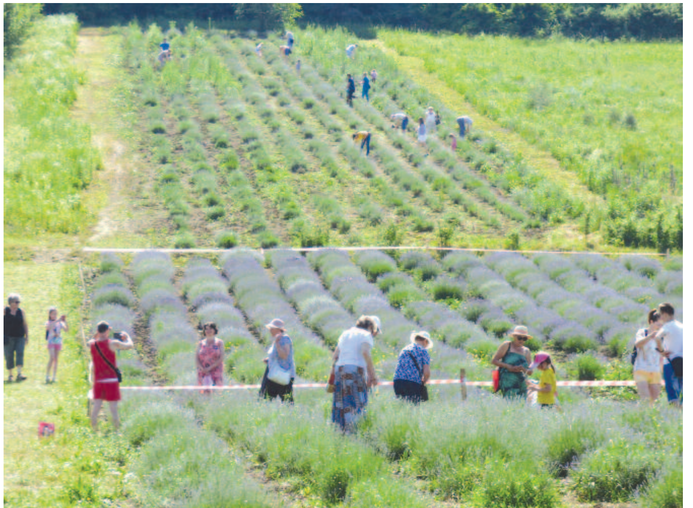
Mintegy ötezer ember fordult meg a két nap alatt a kendi ültetvényen