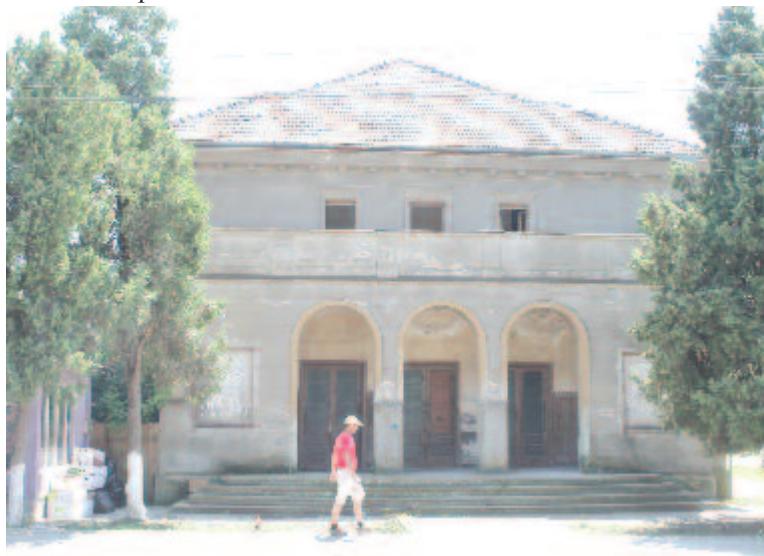
Művelődési házzá alakul a hajdani mozi