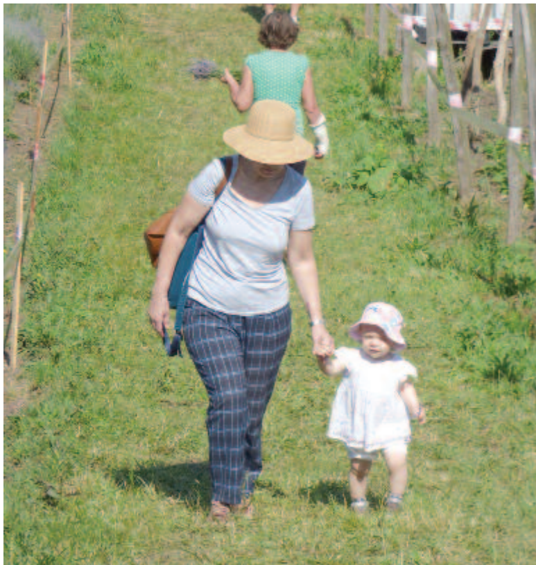
Kicsik és nagyok szívesen érkeztek a hétvégi rendezvényre

Pénteken nem hivatalos megnyitót tartottak a szervezők és az önkéntes segítők, de a faluból is kijöttek néhányan a gitár- és énekszóba bekapcsolódni. Kapuit csak szombaton reggel nyitotta meg a második alkalommal szervezett levendulafesztivál, s bár nem mérték pontosan, már az első nap folyamán mintegy kétezeren fordultak meg a helyszínen. Vasárnap délelőtt is sereglett a tömeg a mezőre, a nap végére mintegy háromezerre becsülték a látogatók számát. Érkezőkor ollót kaptak az emberek, s mellé utasítást is, hogy a levendulának csupán a zöld, kivirágzott részét szabad levágni, aztán ki-ki kedvére gyűjthette a csokorra való, amiért őt lejt kellett visszazérkezőkor befizetni, és ugyanott lehetett a család által előállított levendulatermékekből is vásárolni. Akinek kedve támadt, az egy erre a célra elkülönített parcellában