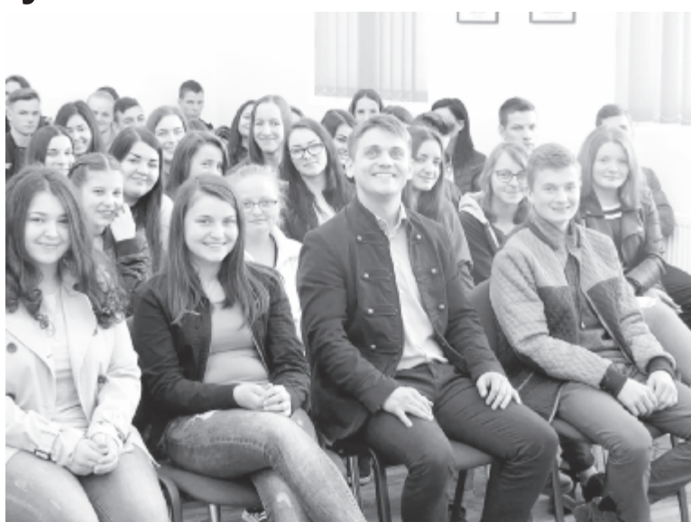
Számos előadót hívtak meg az iskolába a diákok

Az iskola szakoktatási részlege sem tétlenkedett. A kereskedelmi szakosztályoknak meghirdetett Szakmasztár nevű versenyen a