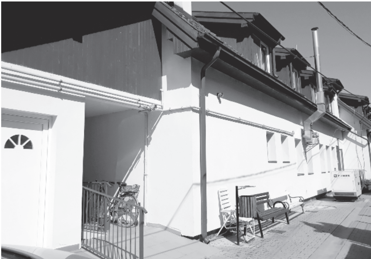
Négy helyre lehet jelentkezni a négy éve bővített intézménybe

A megüresedett helyekre fennjáró vagy kisebb egészségi gondokkal küszködő személyeket fogadnak, ehhez egy orvosi ajánlás és egy társadalmi helyzet-felmérés is szükséges. A helyi önkormányzat alárendeltségébe tartozó intézményben a bentlakónak vagy hozzátartozójának havi 1800 lejese saját hozzájárulást kell befizetnie, ha pedig az illető gyógyszeres ellátásra vagy ágyhoz kötötten pelenkázásra szorul, ezek költségei is őt terhelik – részletezte az intézmény illetékes. Az érdeklődők a 0786-493-092-es telefonszámon kaphatnak más információkat. (GRL)