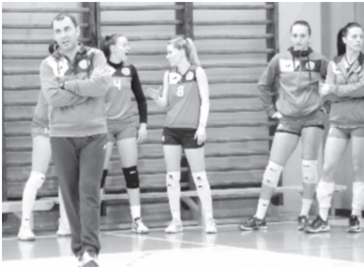
A Marosvásárhelyi CSM edzője (b) az élvonalban is megőrizné az idén bejáratott fiatal csapat magvát.

– Néhány nagyon magas szintet képviselő légiósra lenne szükség ennek a teljesítéséhez. Én ugyanakkor ragaszkodom hozzá, hogy őrizzük meg az idén bejáratott fiatal csapat magvát, mert ha csak a második ligában használtuk őket, csak az időt pocsékoltuk. Van a csapatban hat-hét