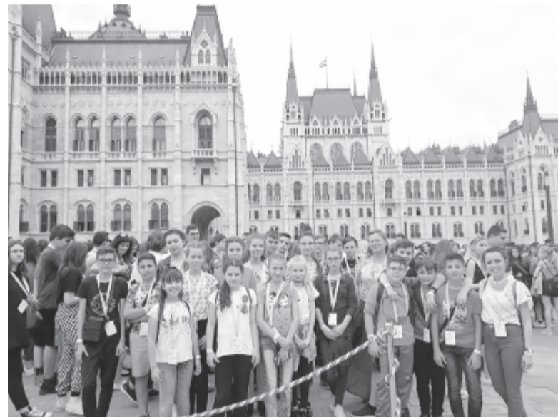
A csikfalvi iskola diákjai is az Országház előtt énekeltek

kérdése nem az, hogy milyen határköveket gördítenek elénk, hanem hogy gyermekeinknek is magyar jövőt tervezünk-e. Nemzetünk jövője ma sem nagyhatalmak, tőlünk független erők, hanem a magyar édesanyák és édesapák kezében van. Amikor ezen az évfordulón megállunk, akkor valójában nekik mondunk köszönetet: azoknak a szülőknek, nagyszülőknek, akik minden körülmény ellenére úgy döntöttek, hogy gyermeküket, unokájukat magyarként nevelik fel. Aki átadták számunkra nemcsak az anyanyelv kincsét, de azt a tudatot is, hogy tartozunk valahova: a magyarság nagy családjába. A nemzeti összetartozás napján ezt a helytállást, ezt a példa nélküli egységet ünnepeljük” – hangsúlyozta az ün-