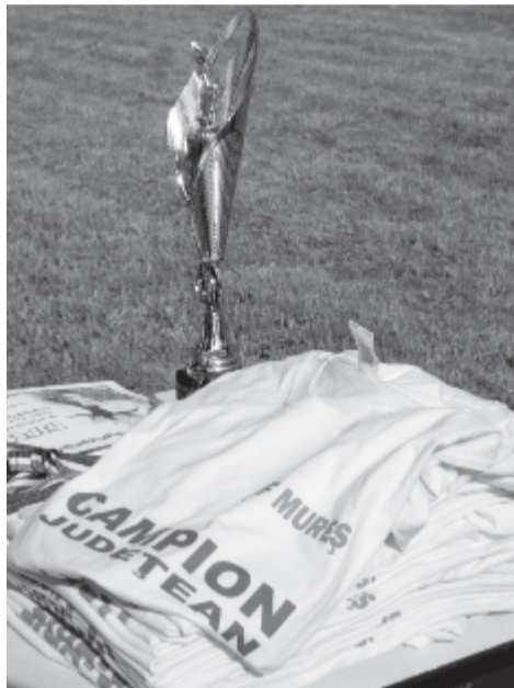
Bajnoki mez és serleg