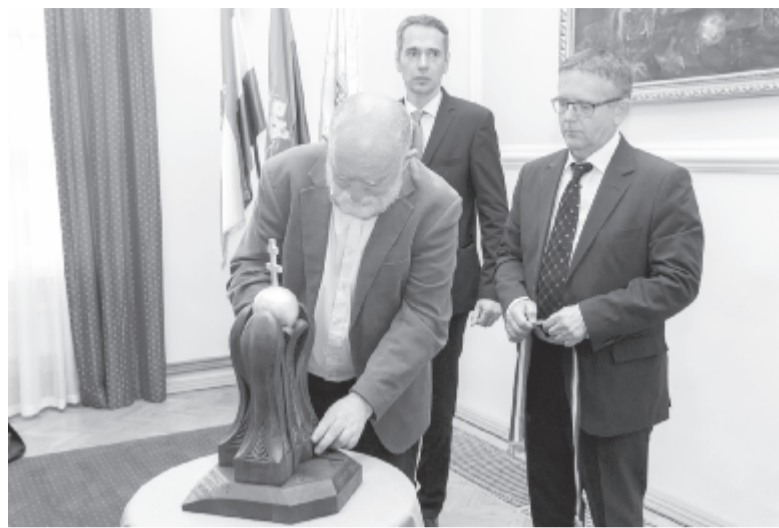
Tatán minden évben teljessé válik az összetartozás jelképe

Ennél rendhagyóbb módon jelzi az anyaország és Erdély kapcsolatát a Bözödújfaluiért Egyesület, amely a napokban a budapesti Magyarország Házában állított fel reklámfelületet, amely a bözödújfalusi tónál épülő Összetartozás templomát népszerűsíti. Az egyesület A szeretet erősebb a pusztításnál jelszóval indított adománygyűjtési és népszerűsítő kampányt, hogy sokakhoz eljusson az elpusztított küküllömenti falu híre. A nemzeti összetartozás napján nem más, mint Keresztes Ildikó állt az ügy mellé, arcát adva a kampány-