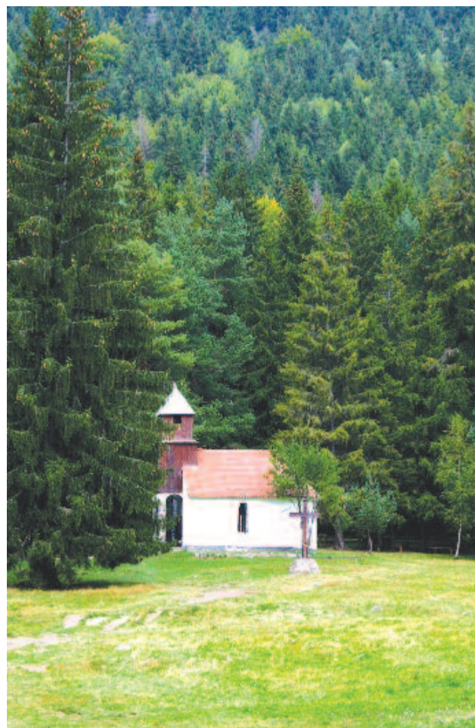
A lélek gyönyörtől áradoz e fájdalommal édes zenétől

A geológia viszonyla-gos és abszolút kormeg-határozást alkalmaz a kőületek időrendi megjelenésének meghatározására. De ha meg akarjuk érteni a földi élet időbeli és térbeli fejlődését, elengedhetetlen a kőzetek és kőületek abszolút kormeghatározása. Az 1870. július 27-én született Bertram Borden Boltwood amerikai fizikus, kémikus ennek megoldását hagyta örökségül a természettudománynak. Radioaktivitással, radioaktív bomlási sorok felderítésével foglalkozott.