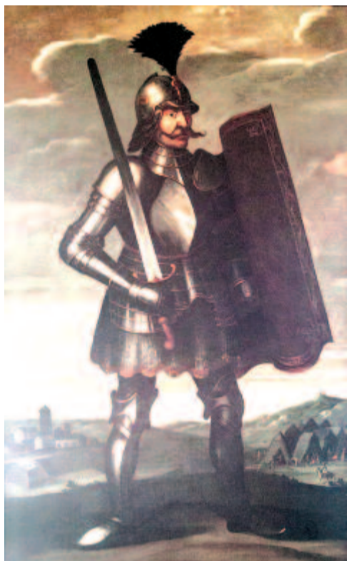
Hunyadi János egy 17. századi festményen

1456. július 22-én a Nándorfehérvárt, a mai Belgrádot védő magyar, szerb és más harcosokkal is kiegészült seregek megsemmisítő vereséget mértek II. Mehmed török szultán hadaira. Mindmáig ennek a hadi sikernek állít emléket a déli harangszó. A győzelem 555. évfordulója alkalmából a magyar Országgyűlés 2011. július 4-én a napot a nándorfehérvári diadal emléknapjává nyilvánította. Idén, a magyar hadtörténet egyik legnagyobb győzelmének 563. évfordulóján, a magyar és a szerb államelnökök közösen leplezték le a törökverő hadvezér, Hunyadi János szobrát.