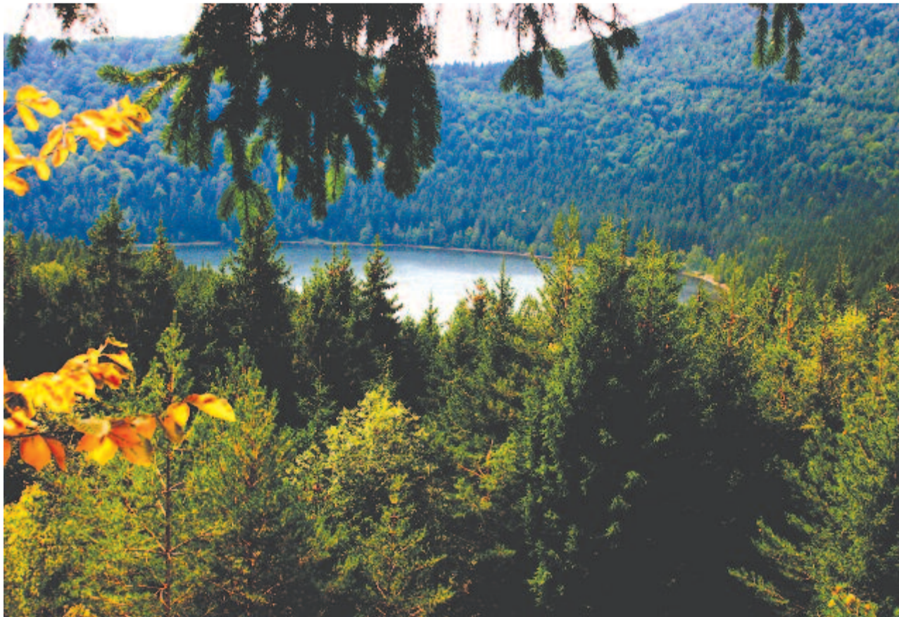
Körül roppant fenyők emelkednek, mintegy sötét rámába fogva az ércvilágú vízlapot

Maradok kiváló tisztelettel. Kelt 2019-ben, Anna napján