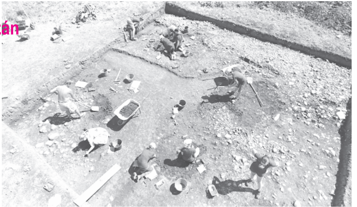
Rábukkantak a római útra és egy lehetséges kovácsműhelyre

A lelőhely megismerésében sokat segített, hogy a községben elkezdődtek a csatornázási és vízhálózat-bővítési munkálatok, így most sokkal pontosabban behatárolható a lelőhely kiterjedése, ami a megóvás és a jövőbeli tervezés szempontjából hasznos, és az ezután munkálatok is sokkal jobban beütemezhetők. Mikházán a kutatások intenzívebbek voltak, mint Marosvécsen vagy Sóvárádon, ahol nem lehet kiszámítani, mi kerülhet elő egy építkezés, közművesítés során, ami esetleg megnehezíti a tervezést vagy pluszköltséget ró a beruházóra. Mikházán a leletmentő ásatásokat sikerült az idén nagyjából befejezni, ezért a tervásatásokra is tudtak koncentrálni. A római erődítmény parancsnoksági épületének délnyugati sarkát nyitották fel, ahol az épület utolsó, 3. századi fázisa is jól megmaradt, s ezzel az épület alaprajzát tisztázták, ami azért fontos, mert a múzeum szeretné hosz-