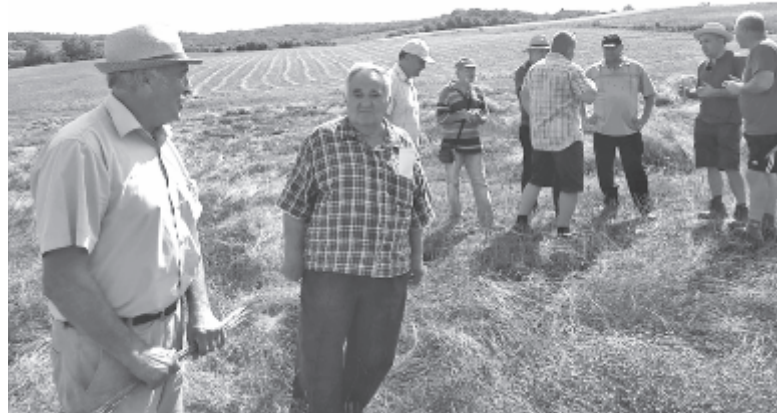
Fotó: RMGE Maros

Az olajlen egyszerű termesztési technológiát igényel, a sovány talajokon is megterem, és a mifelénk nagyon elszaporodott vadállatok sem zsákmányolják, pusztítják. A tápanyagban szegény területeken is megterem hektáronként két tonna lenmag, ami tíz tonna búza árával is felér. Ha többen elkezdnék mifelénk is az olajlen termesztését, komolyabb eredmények is mutatkoznának – állítja az elnök, aki szerint fontos, hogy a szervezet a „problémás” témákat úgy köze-