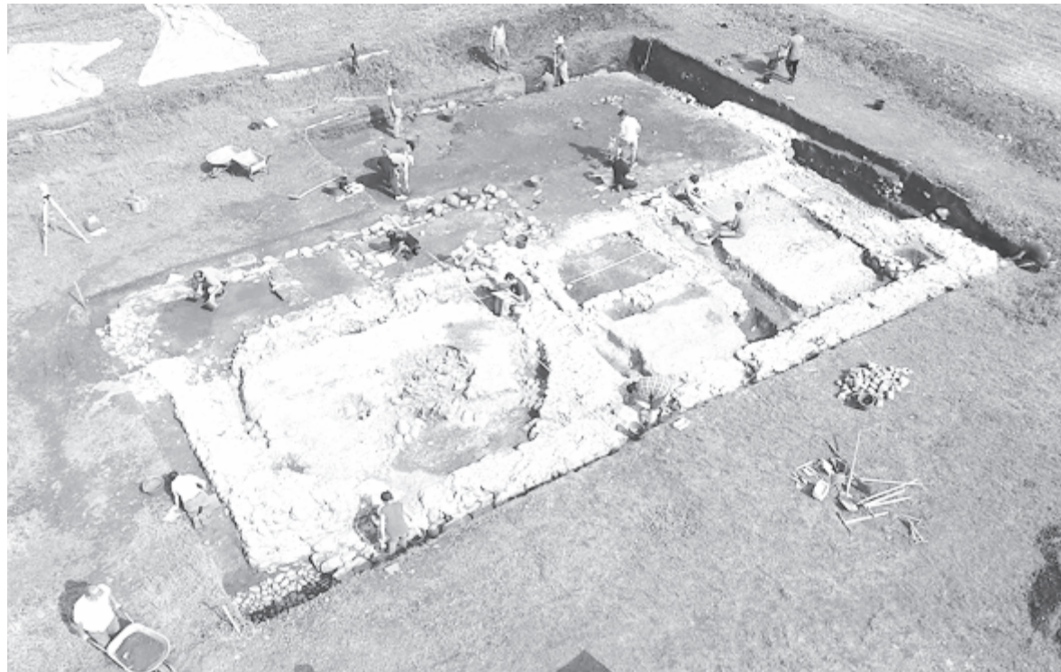
Folytatódott a parancsnoksági épület feltárása

Az idei tervásatások július 21. és augusztus 18. között folytatók, a múlt héten pedig a dokumentáció elkészítésével zárultak. A kutatásokba 2013 óta bekapcsolódnak a berlini Humboldt és a kölni egyetem munkatársai és hallgatói, emellett fontos partner a kolozsvári Babeş-Bolyai Tudományegyetem, tucatnyi hallgató vett részt az ásatásokon, de évente bekapcsolódnak a Pécsi Tudományegyetemről is, és a budapesti Műegyetemnek is megvan a szerepe a lelőhely bemutatásában, népszerűsítésében, a mikházi népi építészet felmérésében. Idén nyáron harminc diák és kutató dolgozott a mikházi ásatásoknál, a faluból is vannak évek óta munkatársak, akiknek a rutinja sokat jelent, és nekik is köszönhető a siker. A feltárást eredményeit megvizsgáló a napokban Mikházára látogatott a hazai Római Limesbizottság elnöke, dr. Felix Marcu, aki a kolozsvári Erdélyi Történelmi Múzeum igazgatója.