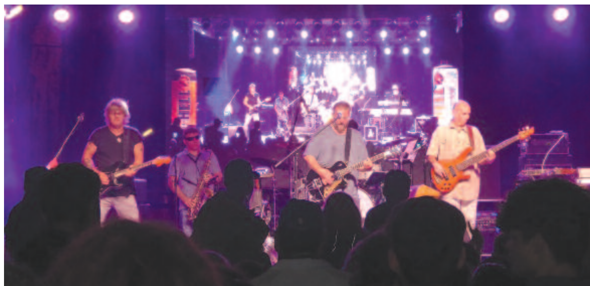
Az eső sem a sportolókat, sem a nagykoncerteken bulizókat nem űzte el

A napközisek és óvodások például öt első díjat szereztek a Kis tehetségek vetéledő megyei szakaszán, az előkészítő osztály második helyezést ért el a Kárpát-medencei Legendárium fesztiválon, az elsősek dicséretet értek el az Ol-