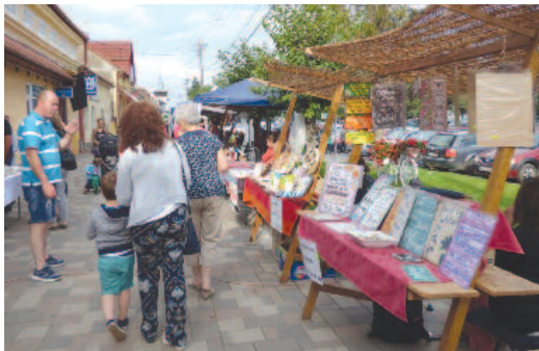
Nagy volt az érdeklődés a kézművesvásárban is