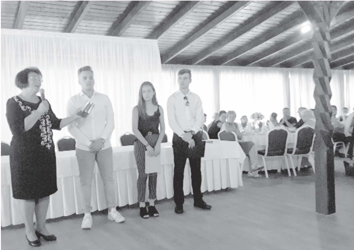
Vasárnap díjazták a legjobb három szavalót