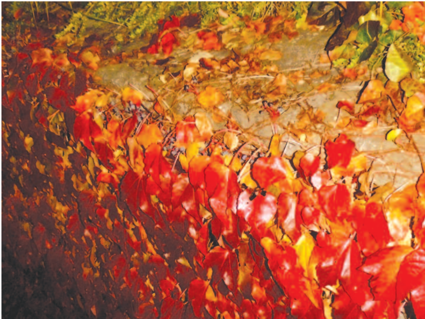
Hűtlen-hű szeretőm, gyönyörű ősz, mért is mész el, ha mindég visszajössz

Kelt 2019-ben, 170 évvel a világsi fey-verletétel után.