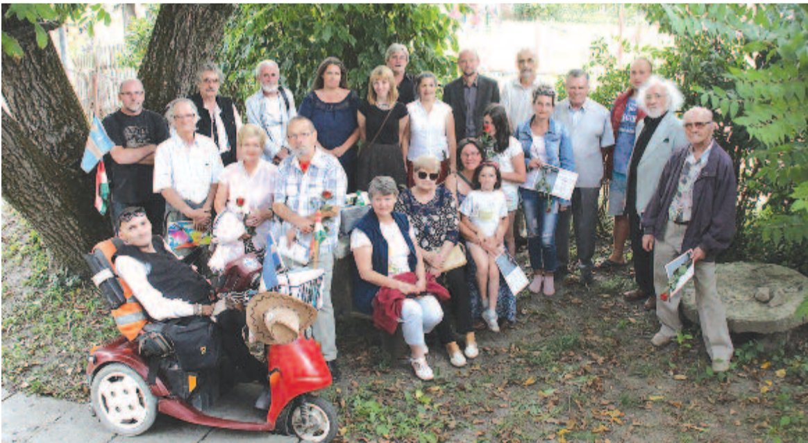
A XXVII. makfalvi Nagy Pál Alkotótábor résztvevői