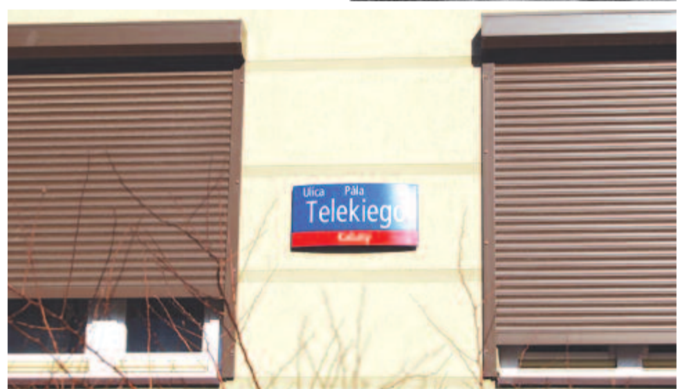
Teleki Pál (fent) és a róla elnevezett varsói utca névtáblája