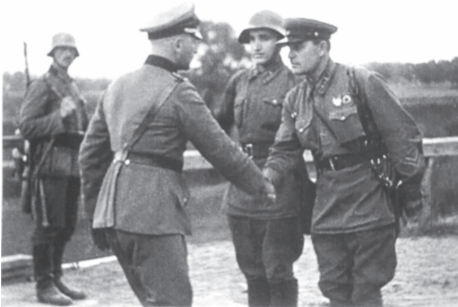
Náci-szovjet baráti kézfogás valahol a szétdarabolt Lengyelországban