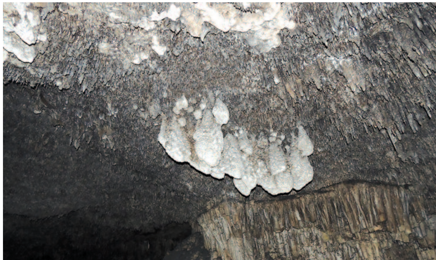
Zsákszerűen elvastagodó cseppkövek a Coves de Artá-barlangban.