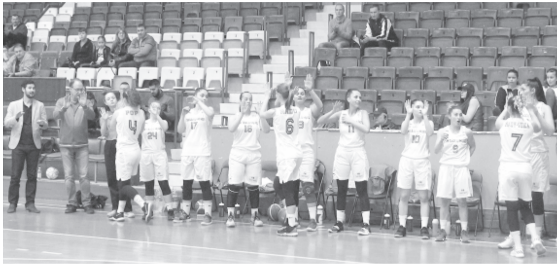
Az elmúlt évadban a városi klub nevében szereplő együttes visszatért a korábbi szervezeti formához

A teljesítménysport nélkül maradt városban pedig majd a példakép nélkül maradt gyerekek is inkább a számítógépen játszanak majd FIFA-t, bármennyire is szeretné egy bizonyos frakció a városi tanácsban, hogy kizárólag a tömegsport maradjon meg. Nem, uraim! Teljesítménysport nélkül tömegsport sincs. Semmi sincs. Csak egy kései sirató.