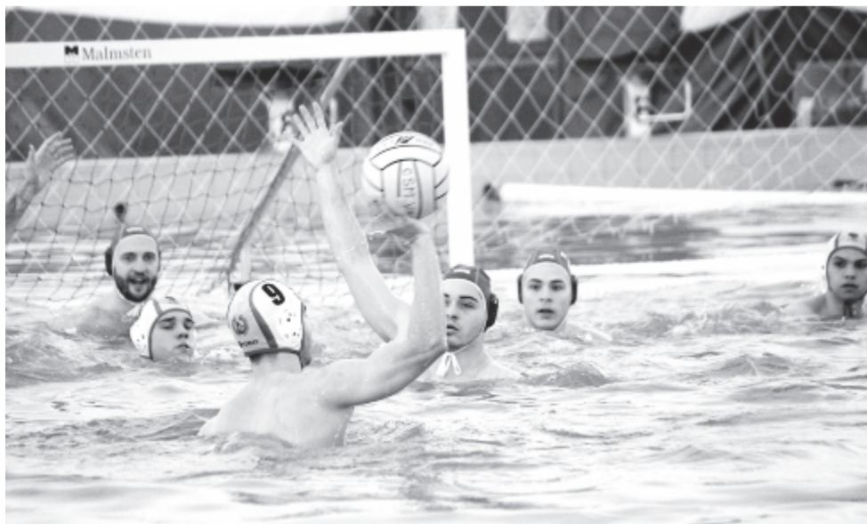
Újra felnőttvízilabda nélkül maradt a megyeszékhely