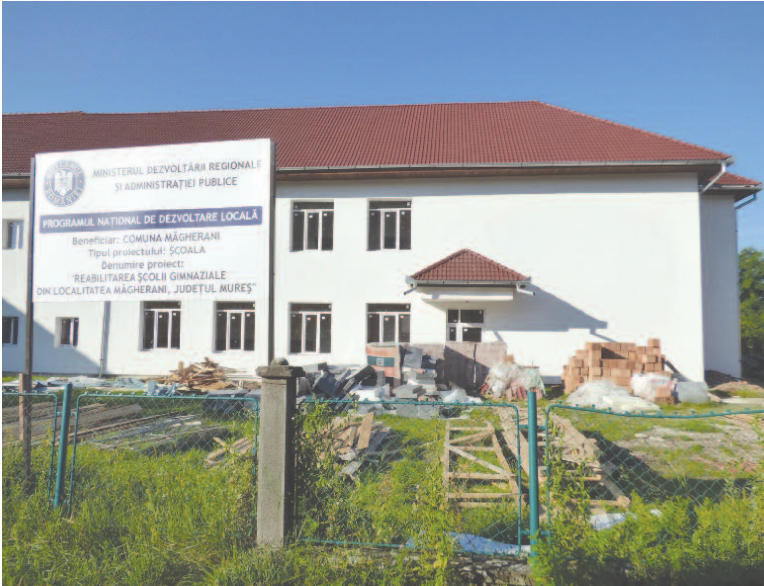
Nyárádmagyaróson folyik a munka, de az osztályok nem költöznek ki