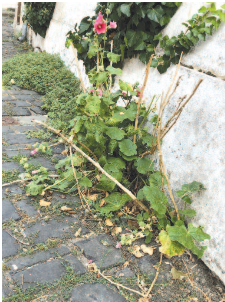
Az utcasarkon borostyángirland tövében mályva üzeni még a nyár színeit

113 éve, 1906. szeptember 8-án halt meg Hőgyes Endre akadémikus. Előbb a pesti egyetemen, majd Kolozsvárott tanított, 1883-tól haláláig ismét a budapesti egyetemen. A bakteriológia tanára volt. Egyike volt a legkiemelkedőbb magyar orvoskutatóknak. Előszörként írta le az egyensúlyérzés reflexívét, s