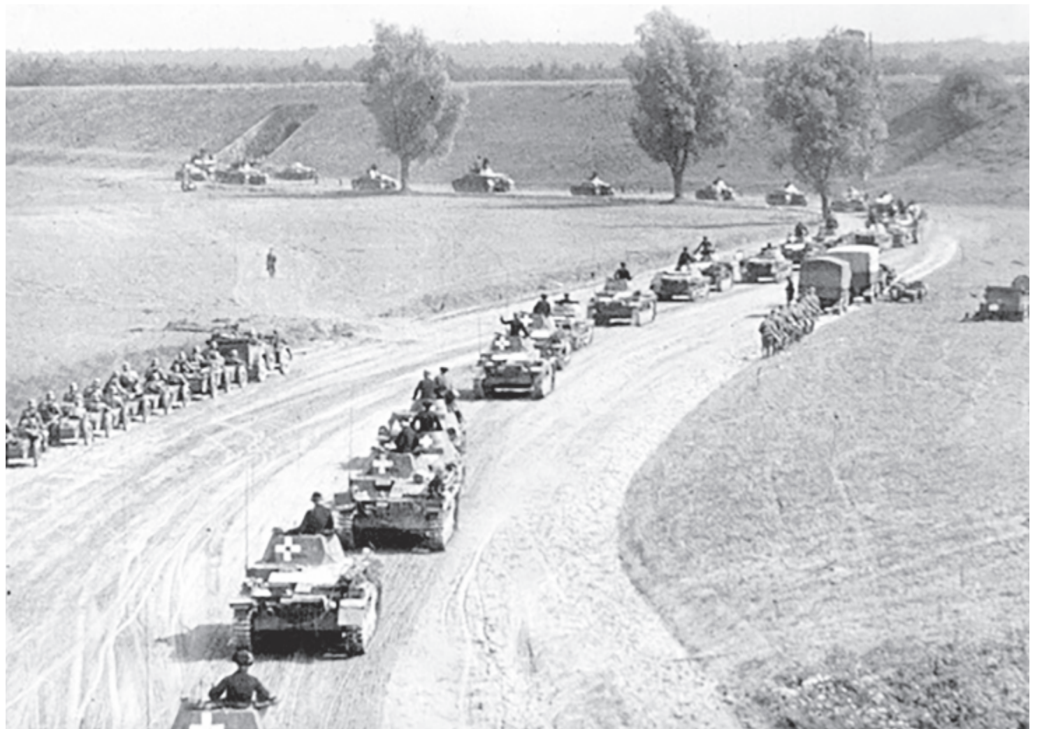
Támadó német páncélos oszlop 1939 szeptemberében

A lengyel védelmi terv, az úgynevezett Zachód (Nyugat) terv szerint a lengyel csapatokat közvetlenül a német–lengyel határra helyezték. A lengyelek ezenkívül nagy hangsúlyt fektettek az ország nyugati határánál fekvő nyersanyaglelőhelyek, iparvidékek és