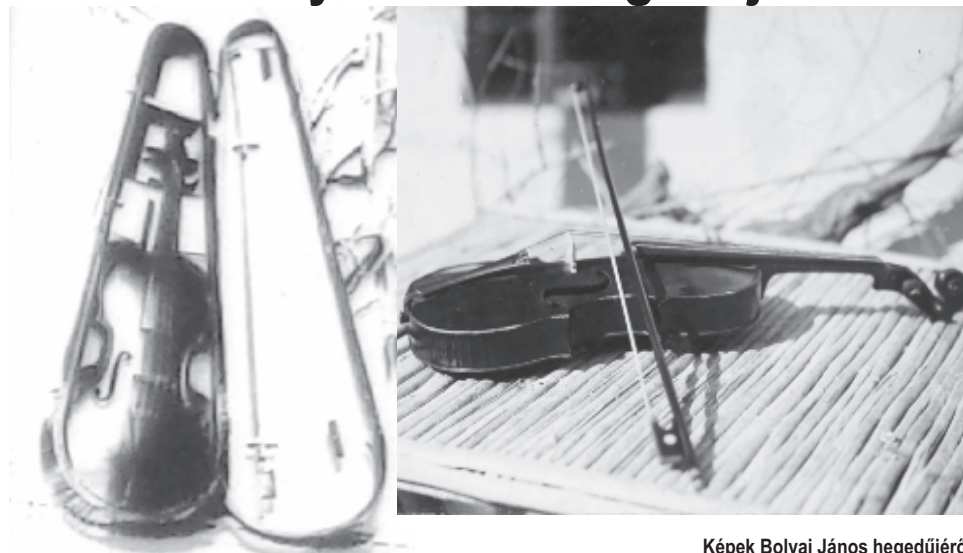
Képek Bolyai János hegedűjéről

Azt, hogy ma megvan-e még Bolyai János hegedűje, és ha igen, hol van, nem tudjuk. Sikertelenül kerestünk olyan adatokra lelnünk, amelyek mindenképpen fontosnak tartunk megosztani a nyilvánossággal, hátha újabb lépéseket téve a kutatásban többet is megtudhatunk még majd e becses Bolyai-relikvia sorsáról.