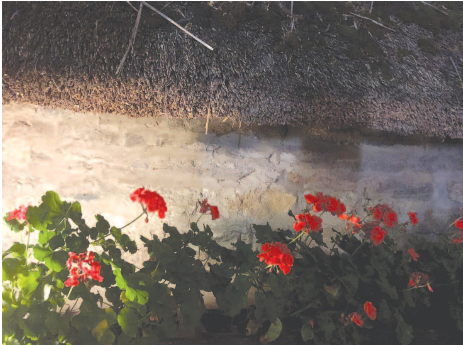
A kihülő ég alatt zsúpfedél oltalmában muskátlik lobbantják nyárból ittragadt színüket

Maradok kiváló tisztelettel. Kelt 2019-ben, 217 évvel Mátyus István halála után