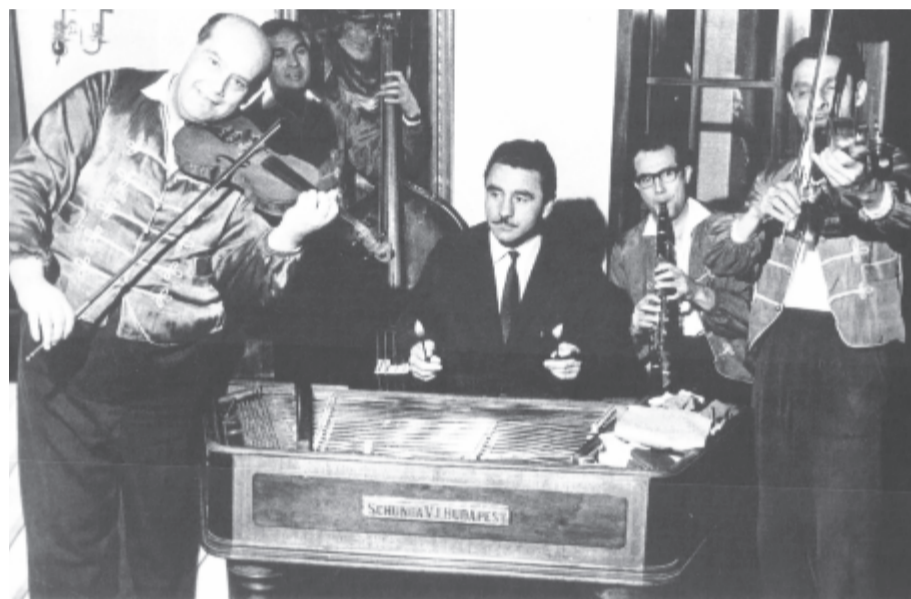
A kép Nyáry Krisztián Igazi hősök című könyvéből származik

Sportkedvelők számára Papp László példakép, de jó, ha tudjuk, hogy a muzsikálásban is kitűnő volt. Egy Koppenhágában vendégszereplő cigányzenekarban cimbalmon játszott. Útós volt a hangszeren és a porondon is.