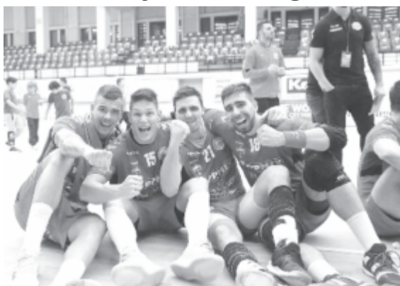
Magyar öröm a román tengerparton

A visszavágót szombaton rendezik Csurgón.