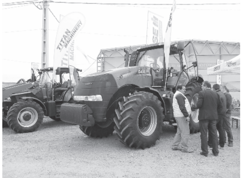
Az előző években is nagy volt az érdeklődés az ákosfalvi kiállítás és vásár iránt

Hogy a megyeközpontból is sokan eljussanak a rendezvényre, illetve beszerezhessenek némi finomságot a család számára, a rendezők ingyenes autóbuszokat is indítanak, amelyek kimondottan a vásárba szállítják az érdeklődőket. A járművek szombaton 10 és 18 óra között közlekednek, óránként indulnak Marosvásárhelyről a 2. számú poliklinika előtti buszmegállóból, de megállnak a Tudor lakótelepben a Jeddí útra vezető körforgalomnál levő buszmegállóban és igény esetén a Sapientia egyetem előtt is. (gligor)