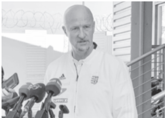
A magyar csapat szövetségi kapitánya elutazás előtt, a repülőtéren nyilatkozott.