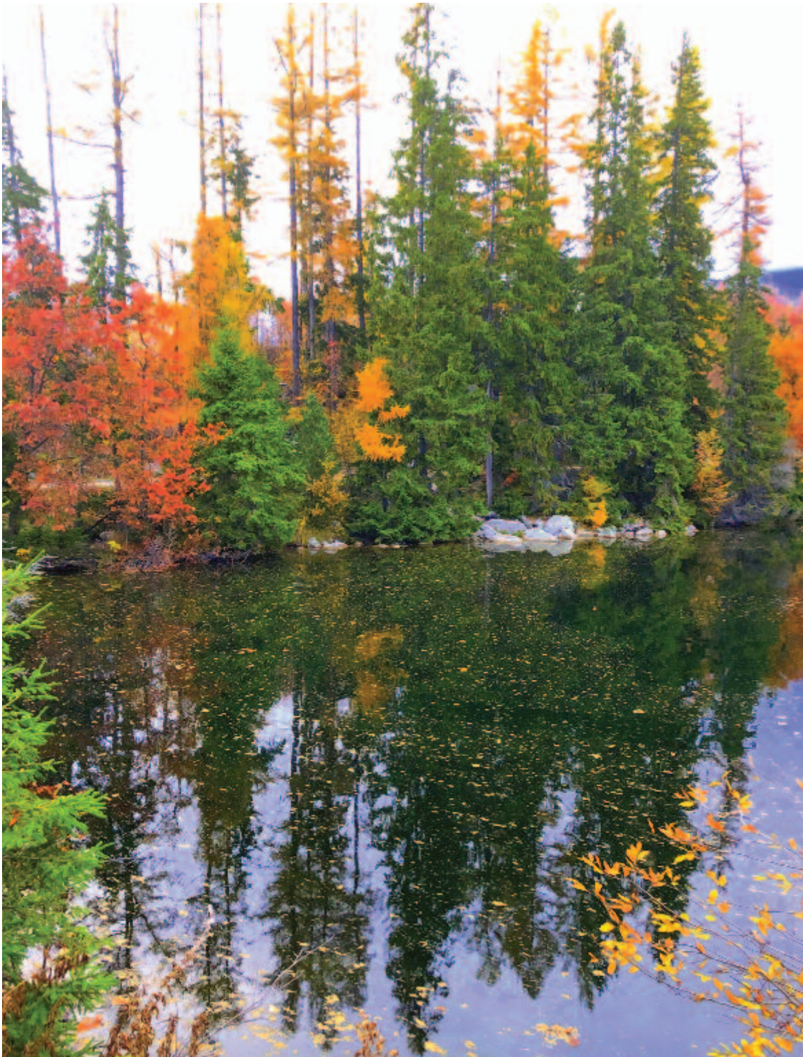
Az Őszkirály, amerre jár, a földre bíbort hajigál

Kelt 2019-ben, 170 évvel a tizenötödik aradi vértanú halála után.