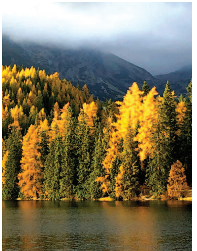
A fények fátyolosak, opálos-mélabúsak

Nem mese, hogy 466 évvel ezelőtt, 1553. október 27-én János máglyára küldi egykori barátját, Szervét Mihály spanyol orvost, jogászt és vallásfilozófust. Szervét or-