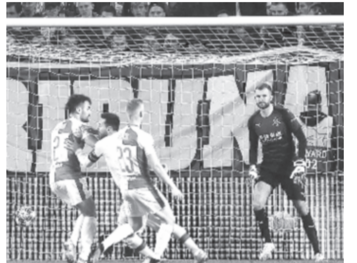
A Barcelona csapatkapitánya gólt szerzett Prágában, ezzel ő lett a BL történetének első játékos, aki sorozatban 15 idényben betalált.

A Salzburg – ezúttal Szoboszlay Dominik nélkül – kétszer is egyenlített hazai pályán a Napoli ellen, az olaszok harmadik találata viszont már nem tudott válaszolni. Ebben a négyesben a címvédő Liverpool 4-1-re diadalmaskodott a Genk otthonában.