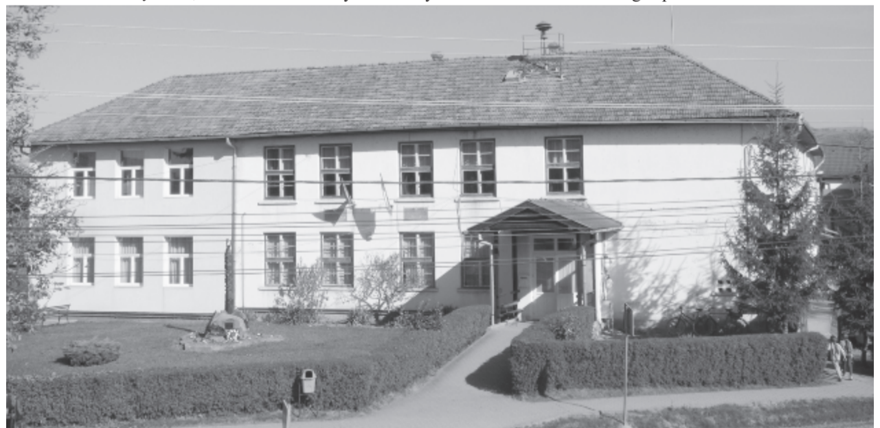
Hatszor kellett meghirdetni a beruházást, amíg sikerült vállalkozót találni