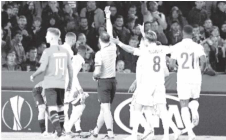
Háromszor is felmutatta a piros lapot a bírót.

November 7-én újra összeméri erejét a két csapat, a csoportkör 4. fordulójában, Kolozsváron.