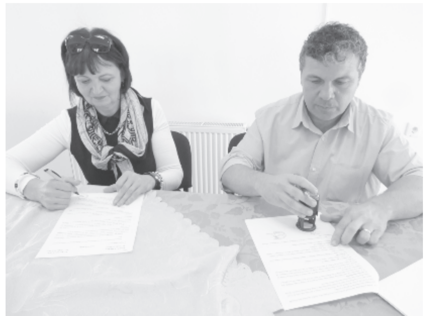
Ha nehezen is, de szerződést tudtak kötni.

A községi tanintézmények állapota nem nevezhető fényesnek, ezért a köz-