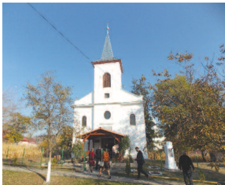
A mezőmehesi templom