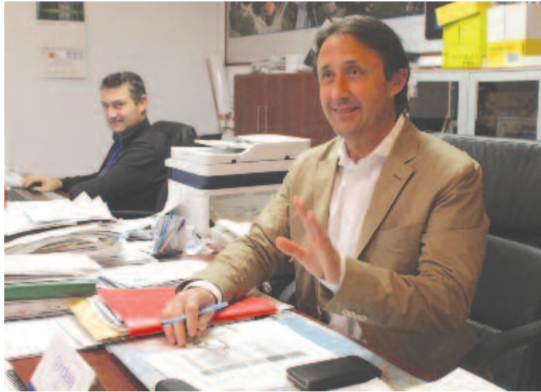
A polgármester és helyettese