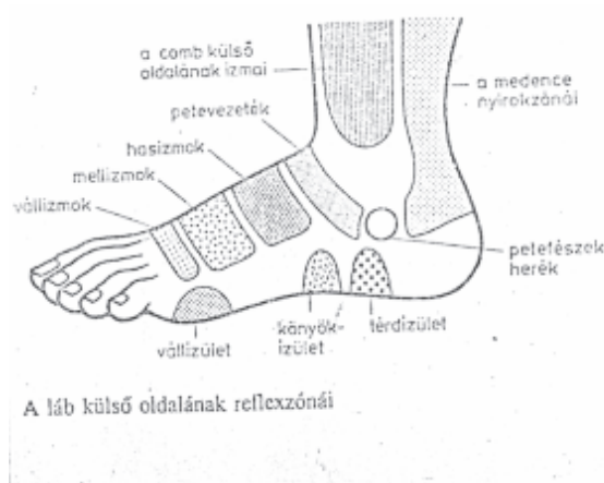
A láb külső oldalának reflexzónái

Következtetés: hiba a kényelmetlen, szűk, vékony talpú cipő, a