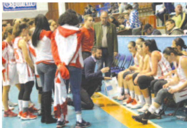
Nem jutott tovább, de bár az első szezonbeli hivatalos győzelmét megszerezte a Sirius-Mureşul (képünk egy korábbi mérkőzésen készült).

Ami mindenképpen öröndetes marosvásárhelyi szempontból, hogy Smelser már az első mérkőzésen nagyon jól beilleszkedett, nem csak a legtöbb pontot szerezte, de 16 lepatanót is szerzett, amivel lényegesen