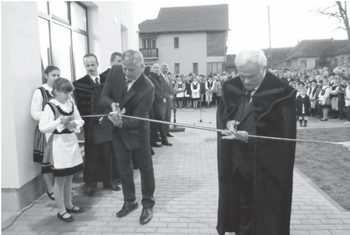
Húsz hónap telt el az alapkövetéltel és az avatás között

Vasárnap délután szalagátvágással adták át Backamadarason azt az óvodát és bölcsődét, amely a magyar kormány és az Erdélyi Református Egyházkerület támogatásával épült a helyi református gyülekezet telkén. Az új intézményben már januártól elkezdődhet az óvodai oktatás, de a napközire még várni kell.