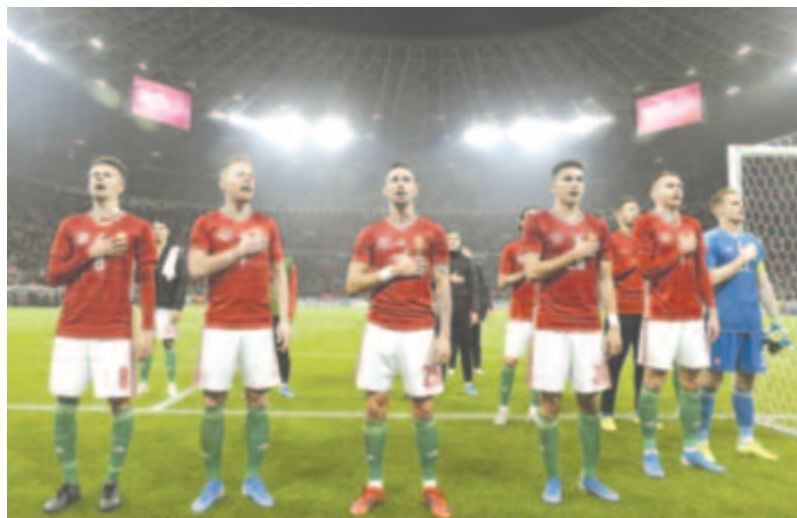
A magyar játékosok a Himnusz éneklésére a Puskás Aréna avatóján játszott Magyarország – Uruguay (1-2) barátságos labdarúgó-mérkőzés végén 2019. november 15-én.