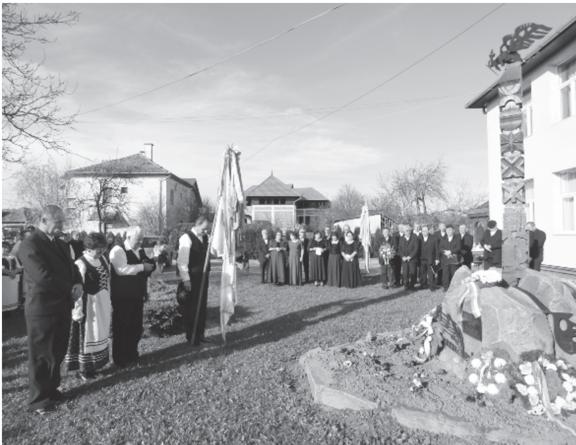
A csíkfalvi emlékoszlopnál tisztelegtek és koszorúztak a kórusok