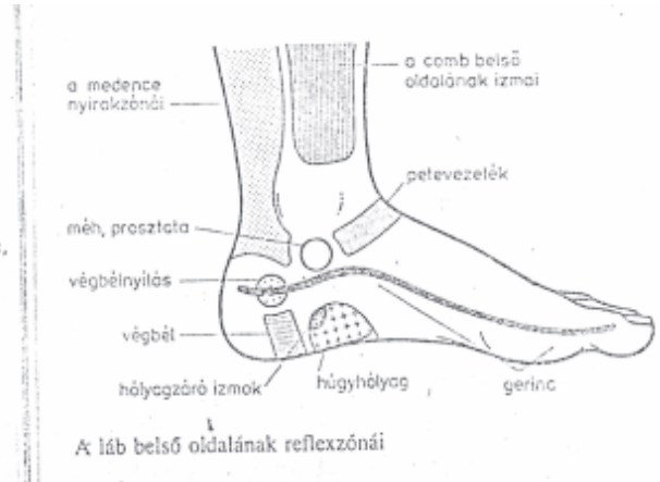
A láb belső oldalának reflexzónái