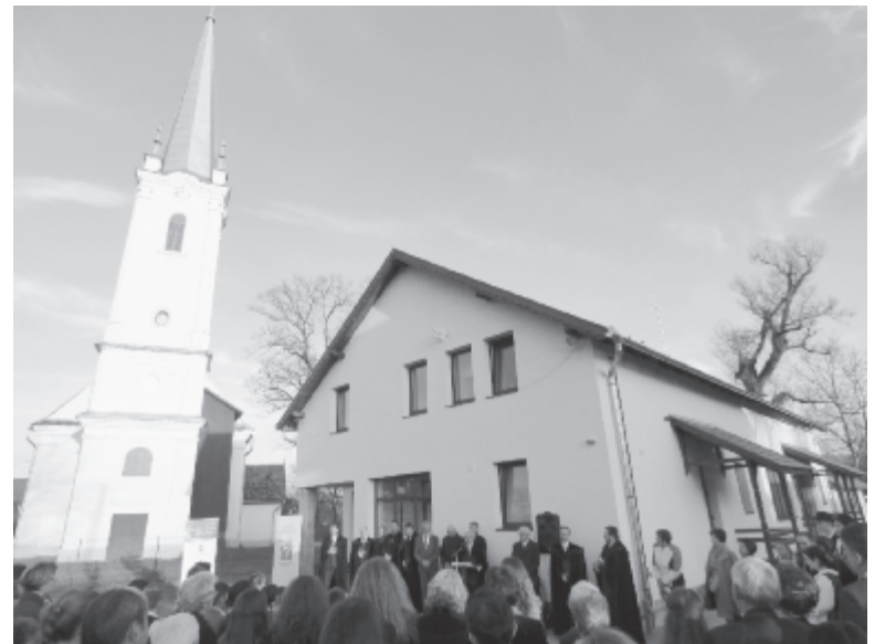
A magyar kormánynak köszönhetően a 120 éves épület helyett új óvodát használhatnak ezután

Az ingatlant egy nyáradszeredai cég építette fel egy év és nyolc hónap alatt, a beruházás értéke 550 ezer euró, amit a magyar kormány biztosított a Kárpát-medencei óvodafejlesztési program keretében az Erdélyi Református Egyházkerület révén.