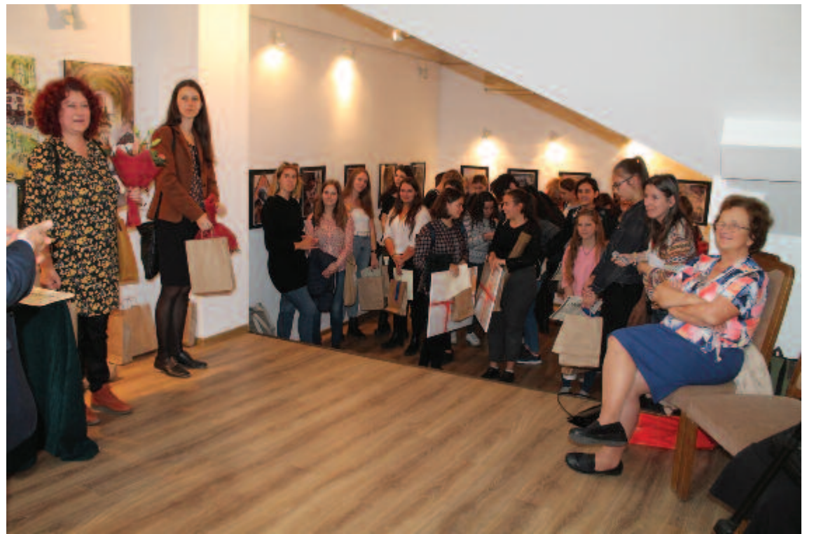
A művészeti középiskolások Bernády városa diákszemmel című tárlatának megnyitóján a Bernády Házban október 24-én

Mért tartottam meg. Mert süldő legény koromban a csávási bálban az a nóta járta, hogy Fehérváry Géza báró alatt nyírték a Ráró, a mellemre kitérték a rézmedáliát, nézték is a leányok. Nekem ne magyarázza, tanár úr, hogy ez Ábrahám Páltól vagy kitől jön, az unokám is mutatta kinyomtatva; de az nem az. Mi úgy