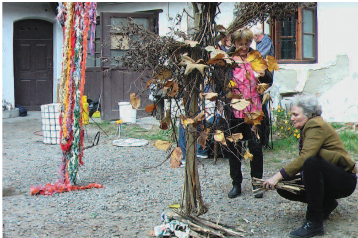
Boszorkányégetés a Bolyai utca 5. szám alatt 2019. október 26-án. Előterben Csiky Szabó Ágnes textilművész.