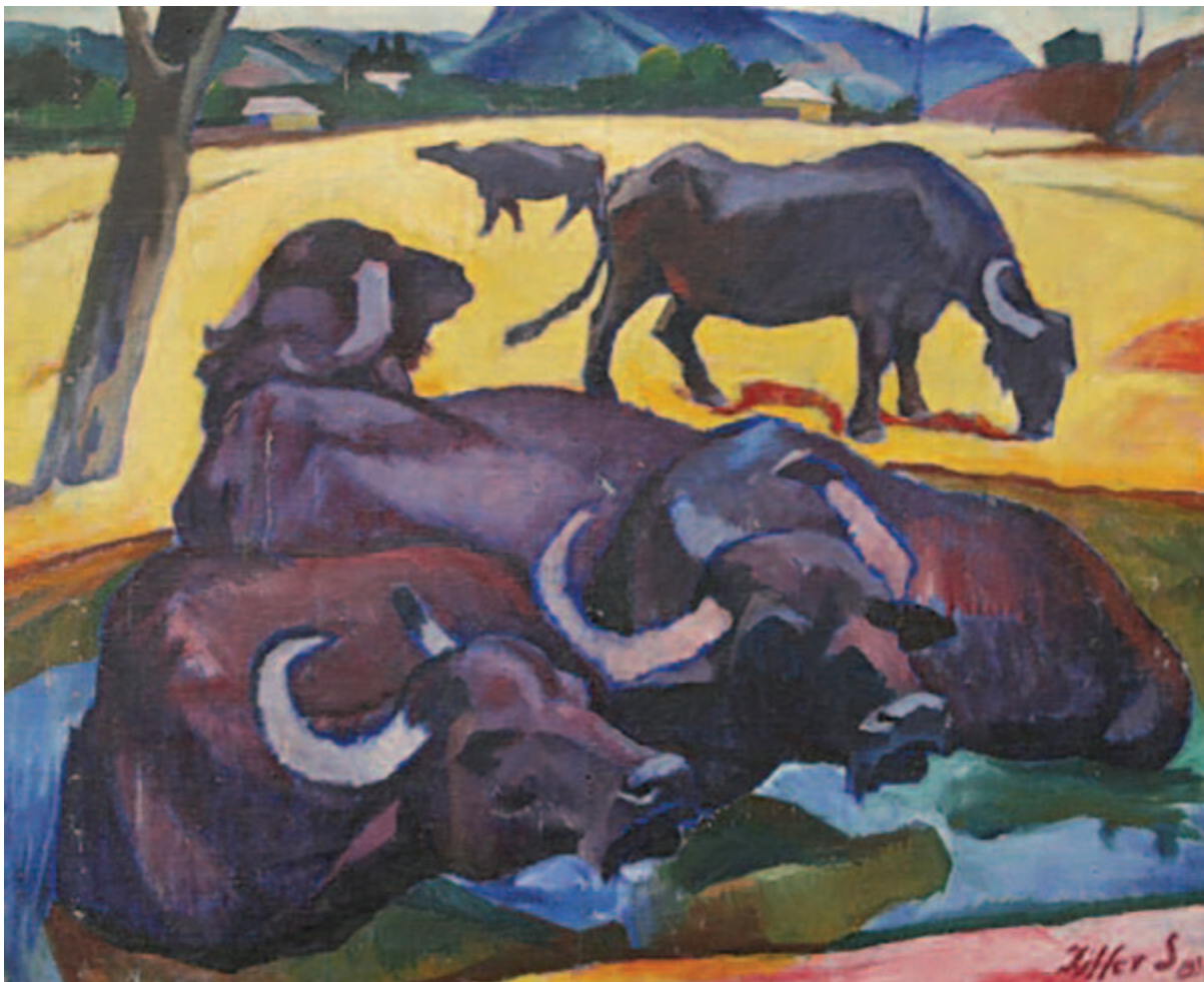
A marosvásárhelyi Kultúrpalotában nyílt Erdély festészete a két világháború között című kiállításról

s lábunk nyomán végigsöpör hű gondnokunk, a himnusz.