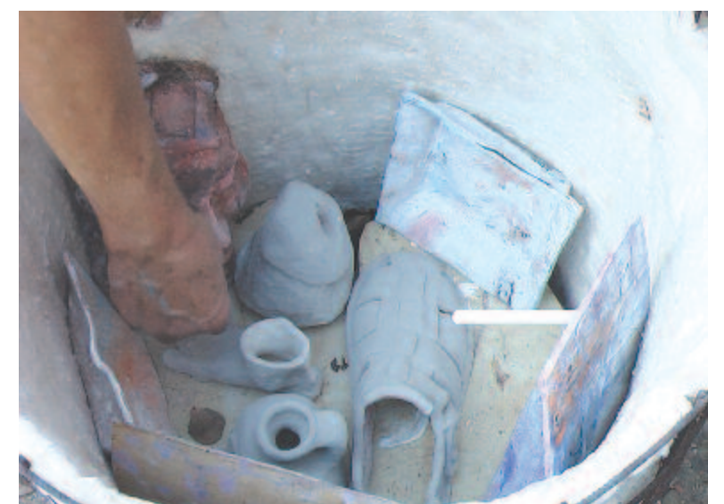
Kerámiák a rakuégető kemencében

énekeltük, hogy Amikor még békebeli volt itt a világ Kassán, meg Pozsonyon túl, baka-sapka mellett nyílt a búzavirág, úr volt ám a vitéz úr.