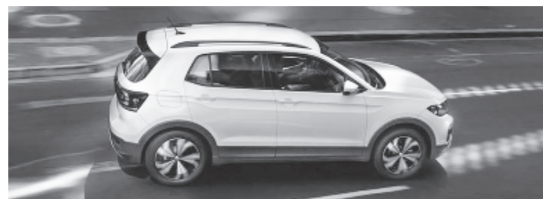
Az új T-Cross

A VW-hez a névadó Volkswagen, az Audi és a Skoda mellett a Bentley, a Bugatti, a Lamborghini, a Porsche és a Seat tartozik, valamint a Ducati sportmotoroké, és saját márkájú haszonjarműveit mellett a Scania és a MAN tehergépjárműveket is a VW gyártja. (MTI)