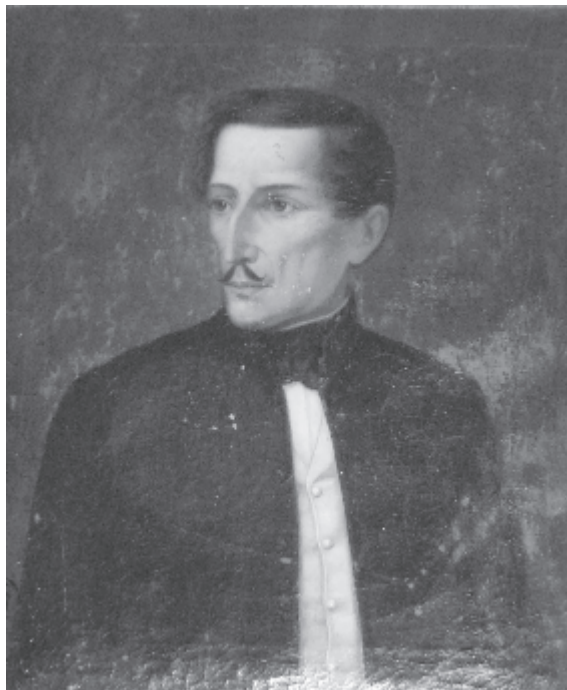
Bölöni Farkas Sándor

„Ha jegyzeteimmel e boldog haza helyzetéről némi felvilágosítást terjeszthetek, sokszorozva lesznek utazásom örömei” – írta. Műve könyvsiker lett, az első kiadást elkapkodták, egy éven belül újra kellett nyomni. Akkorra már a cenzúra is felébredt, a szöveget eredetileg „átengedő” cenzorok megrovást kaptak,