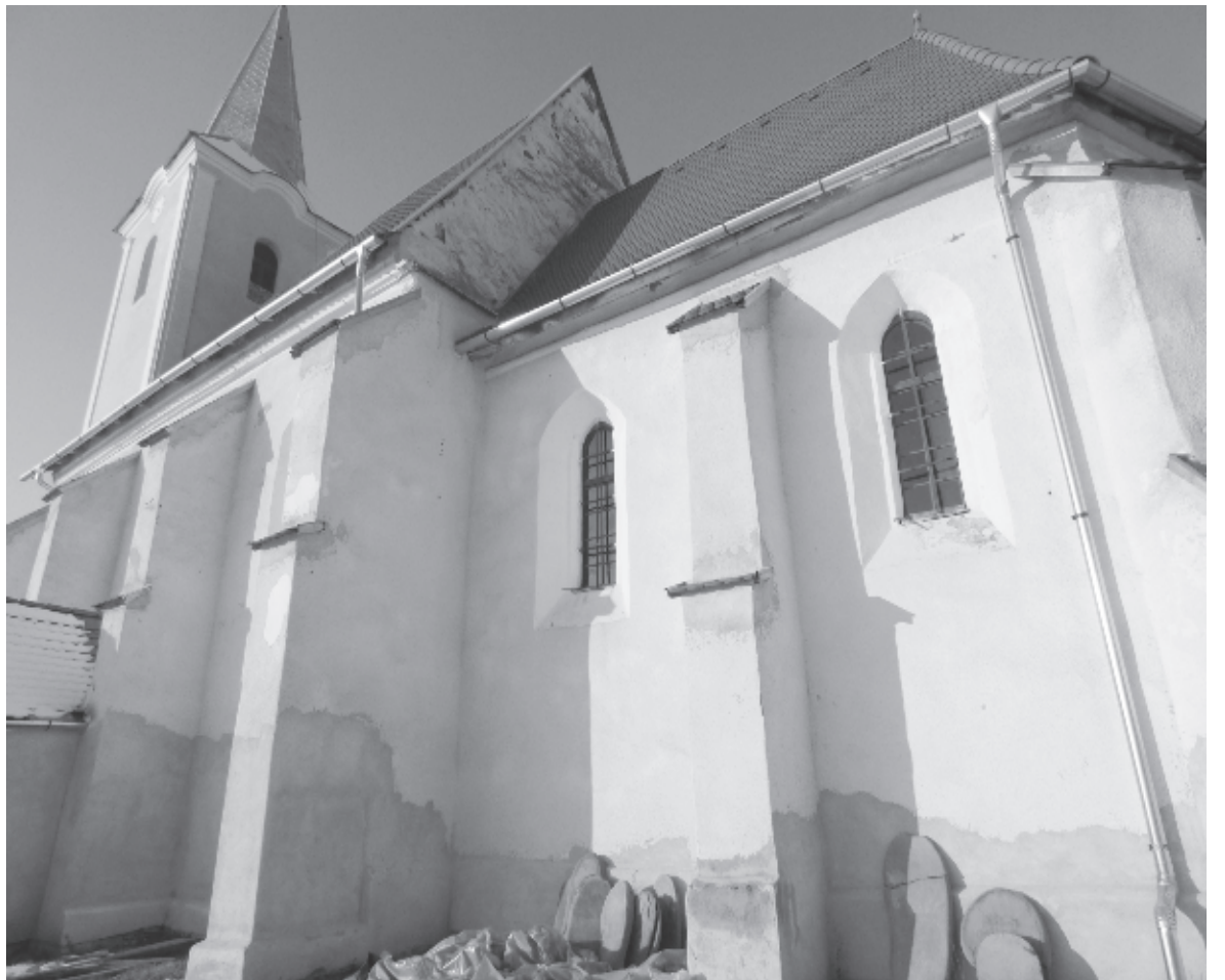
A kazettás mennyezet és a templom külső felújítása még a jövő feladata

A tervek szerint szeptember utolsó szombatján, az őszi hálaadás kapcsán két év után újabb ünnepséget rendeznek, hogy örömeiket és köszönetüket fejezzék ki a templomfelújítás okán, illetve fejet hajthassanak Jakab Elek emléke előtt – számolt be a lelkipásztor.