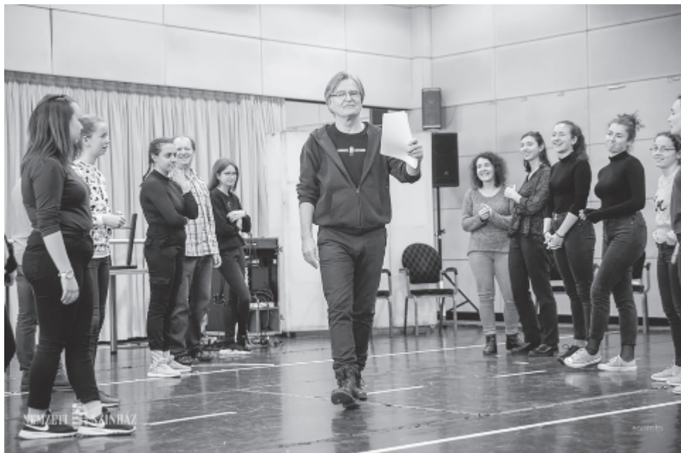
Az előadások mellett a kórus szakmai foglalkozásokon is részt vett