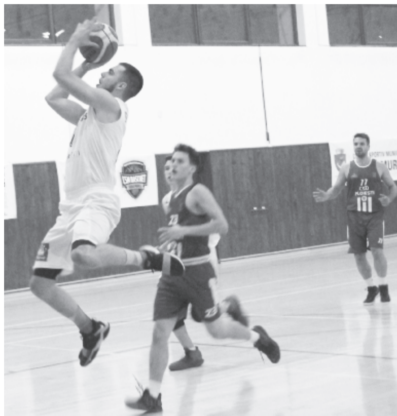
Csak a hazai pályán elszenvedett vereség írható a tisztes kategóriába

Férfikosárlabda 1. liga, 12. forduló: Bukaresti Aurel Vlaicu Főgimnázium – Marosvásárhelyi CSM 109:57 (32-25, 28-15, 26-8, 23-9) Bukarest, Aurel Vlaicu Főgimnázium csarnoka, 20 néző. Vezetők: Vlad Săndulache (Bukarest), Alexandru Costache (Bukarest), Valentin Veselovski (Bukarest). Ellenőr: Romi Stănculescu (Bukarest). Aurel Vlaicu Főgimnázium: Ciucă 26 pont, Duca 13 (1), Șerbănescu 12 (1), Pădureț 12, Popescu 9 (3), Pascal 9 (1), Dumitrașcu 8, Mingote 7 (1), Rasty 6, Niculae 5, El Charif 2. CSM: Bölöni 34 (2), Tălmăcean 6, Ștefan 4, Blaga 4, Bot 4, Szilveszter 2, Barabási Z. 2, Mureșan 1, Györki, Szász.