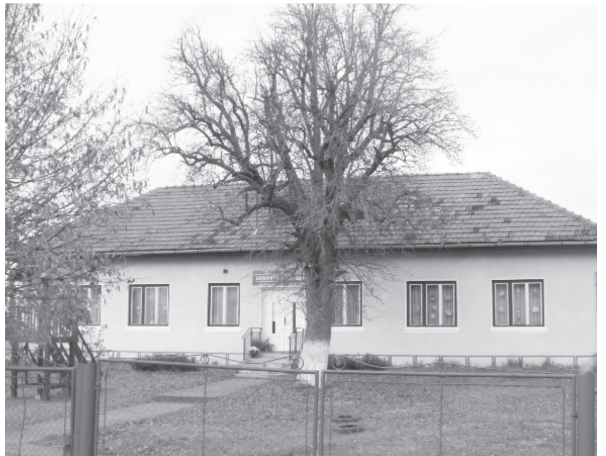
Lukafalván kibővítik és felújítják az óvodát

A gyereklétszám jelenleg enyhén csökkenőben van – mondta el kérdésünkre a polgármester. Amikor a tervet készítették, Teremiújfaluban három óvodai csoport volt, ma már csak kettő van, ezért a tervet módosítani kellett. A másik két településen elenyésző a csökkenés, egy-két gyerekről van szó.