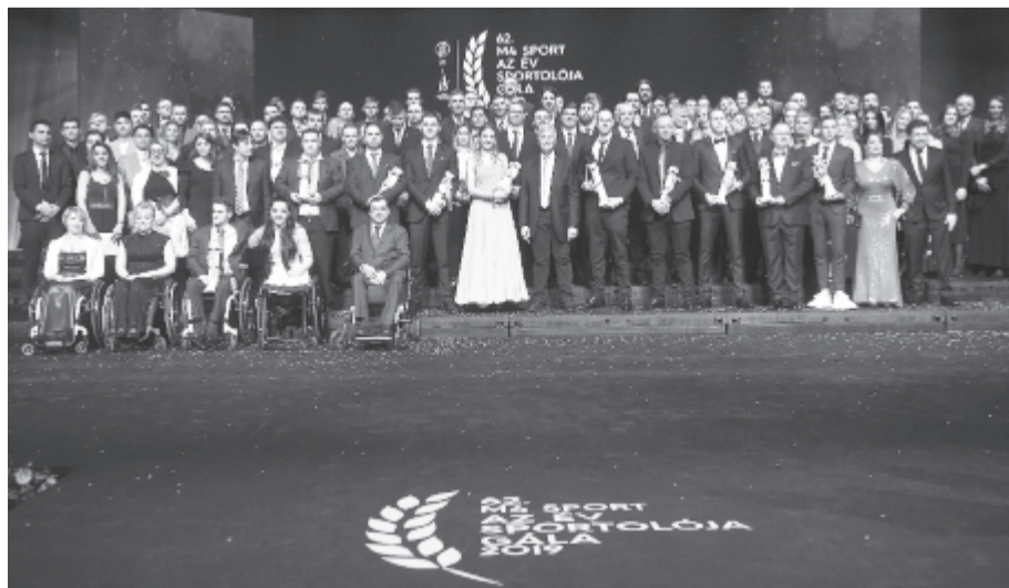
Díjazottak és a díjak átadói az M4 Sport – Az Év Sportolója gálán a Nemzeti Színházban 2020. január 16-án

A 14 díjátadó ceremóniát elválasztó produkciókban összesen 178 fellépő lépett színpadra. Az idei ötkarikás játékokra utalva szerepet kaptak az 1964-es tokiói olimpia hősei.