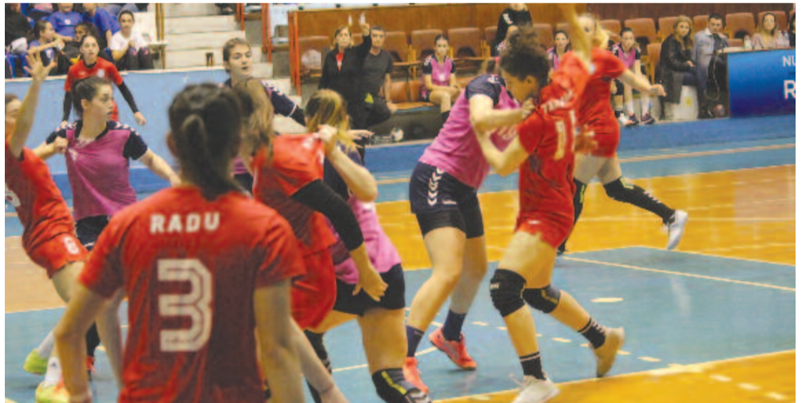
Târșoagă ezúttal három góllal segítette csapatát

A női kézilabda A osztály D csoportjának 11. fordulójában a következő eredmények születtek: Köröskisjenői Crișul – Temesvári Universitatea 39-24, Nagybányai Marta – Resicabányai CSU 27-18, Marosvásárhelyi CSM – Nagyvárad CSU 34-29.