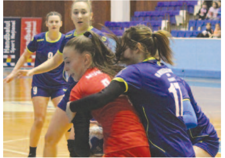
Hiába próbálták, nemigen tudták akadályozni a marosvásárhelyi csapat játékosait a gólszerzésben.

Hogy a feljutásért zajló küzdelemben mire számíthat, nagymértékben függ attól, hogy a január 31-éig tartó átigazolási időszak végéig mi történik. Mihaela Evi edző azt mondta, bár a játékosai közül többet megpróbálnak elődesgetni élvonalbeli klubok is, ígéretet kapott tőlük, hogy az idény végéig biztosan maradnak. Ahhoz azonban, hogy sikerrel kecsegtessen a