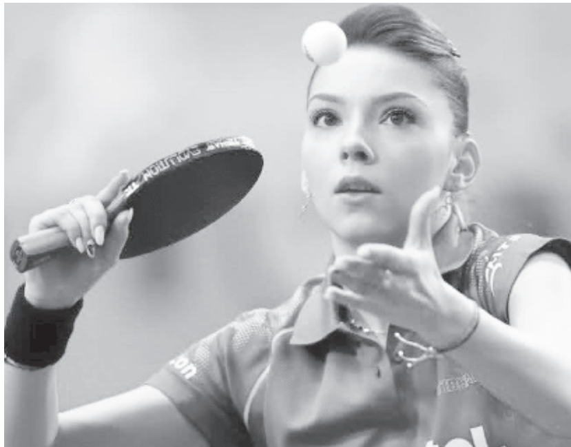
A marosvásárhelyi játékos a válogatott tagjaként lehet majd ott az ötkarikás játékokon.