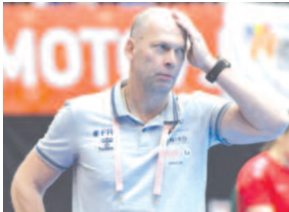
Leváltották a román női kézilabda-válogatott szövetségi kapitányát.