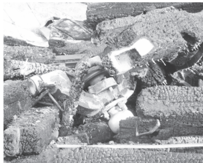
A harangok elolvadtak, csak a tartószerkezetük maradt meg

Az okozott kár – a műemlék megsemmisítése – körülbelül 50.000 euróra tehető – áll a Maros Megyei Rendőr-felügyelőség közleményében. (mezey)