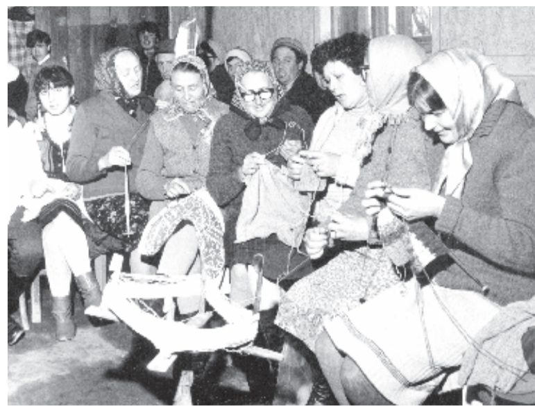
Munka a fonóban: inkább varró-kötő kalála (Teremiújfalú, 1990)

Nagykenden még az 1990-es években is javában működött a sa-játos szatyorkötő fonó. – Mű el-neveztük egyes számú klubnak,