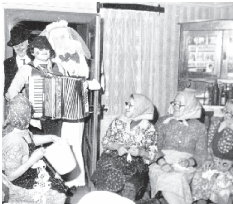
Megjötték a lakodalmas batykók (Gyulakuta, 1989)

makkor gyakorolhatták a maszkos játékokat. A farsangi idő – vízke-resztől hamvazószerdáig – viszont Marosszéken jóval telítettebb, játé-kokban gazdagabb, mint az említett vidékeken, ahol főleg a farsang utolsó napjai jelentették a maszkos alakoskodás alkalmait. A farsangi időt, ünnepkört fársangi hat hétként tartották nyilván a népi kultúrában. Ebben végig felszabadult élet- és világszemlélet érvényesült, és ez táplálta a maszkos alakoskodást is. A farsangi hat hét kiemelkedő játé-kshelye, játéktere a fonó volt. A fonók vagy guzsalyosok, kórusok, fonósegek már az őszi betakarítás után, novemberben megkezdődtek, karácsonykor szünetet tartottak, vízkereszt után újból elkezdődött a fonóidény. A hat hétben a fonót minden este (szombat és vasárnap kivételével, e két napon nem tartot-tak fonót) felkereshette egy vagy több farsangoló társaság. A maros-széki falvakban így a farsangi fo-nókban élte életét a maszkos alakoskodás a teljes farsangi periódusban. A fonókhöz kapcsolódó megnyilvánulási formája a bekérez-tető típusú szobai játékok előadása, a „fonószínház” sokféle változata.