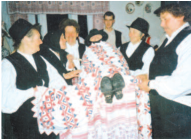
Magyarói farsangi „halott” és siratása (1998)