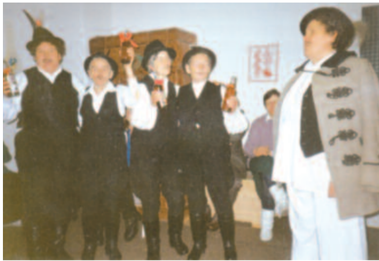
Asszonyok is lehetnek betyárok, Rózsa Sándor a vezérük (Magyaró, 1998)