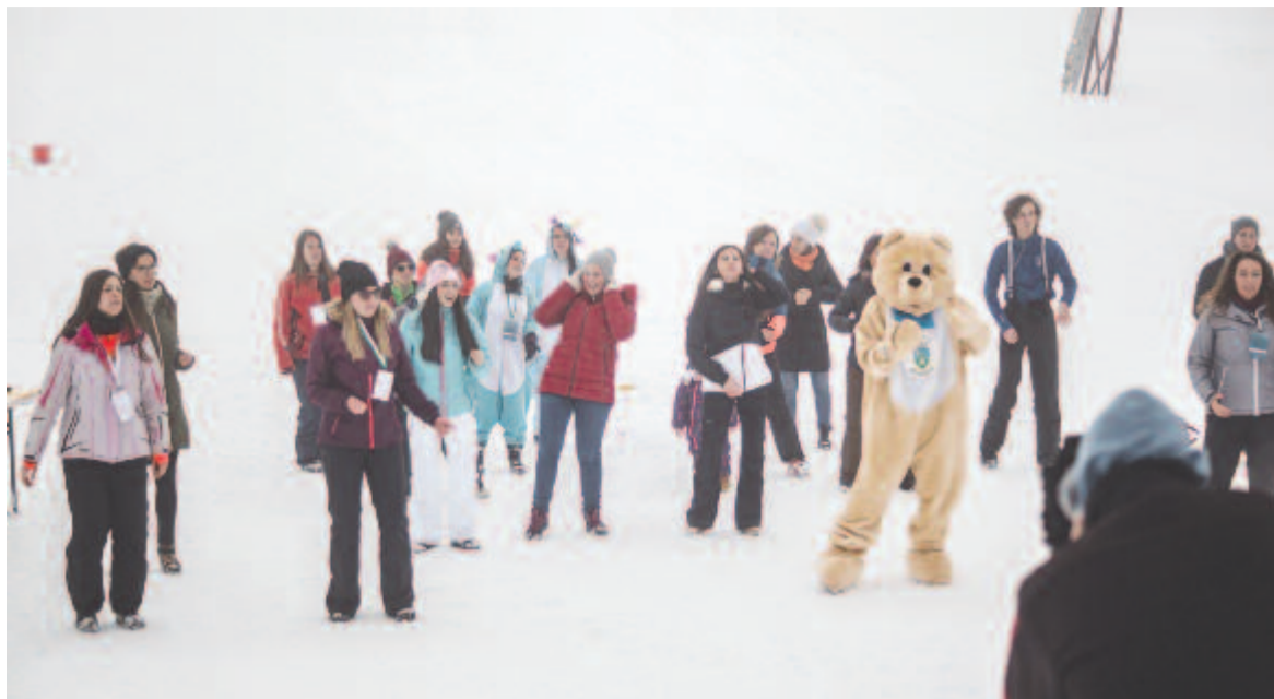
A vártnál kevesebb szovátai ment ki a sípályára, de aki ott volt, remekül szórakozott