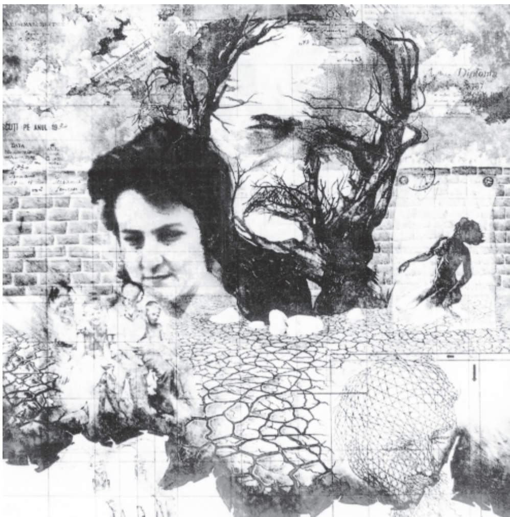
Mellékletünk Vass Tamás munkáival illusztráltuk

120 éve, 1900. március 31-én, Miskolcon született a Kossuth-díjas költő, műfordító, a modern magyar líra egyik legnagyobb alakja. Elhunyt Budapesten, 1957. október 3-án.