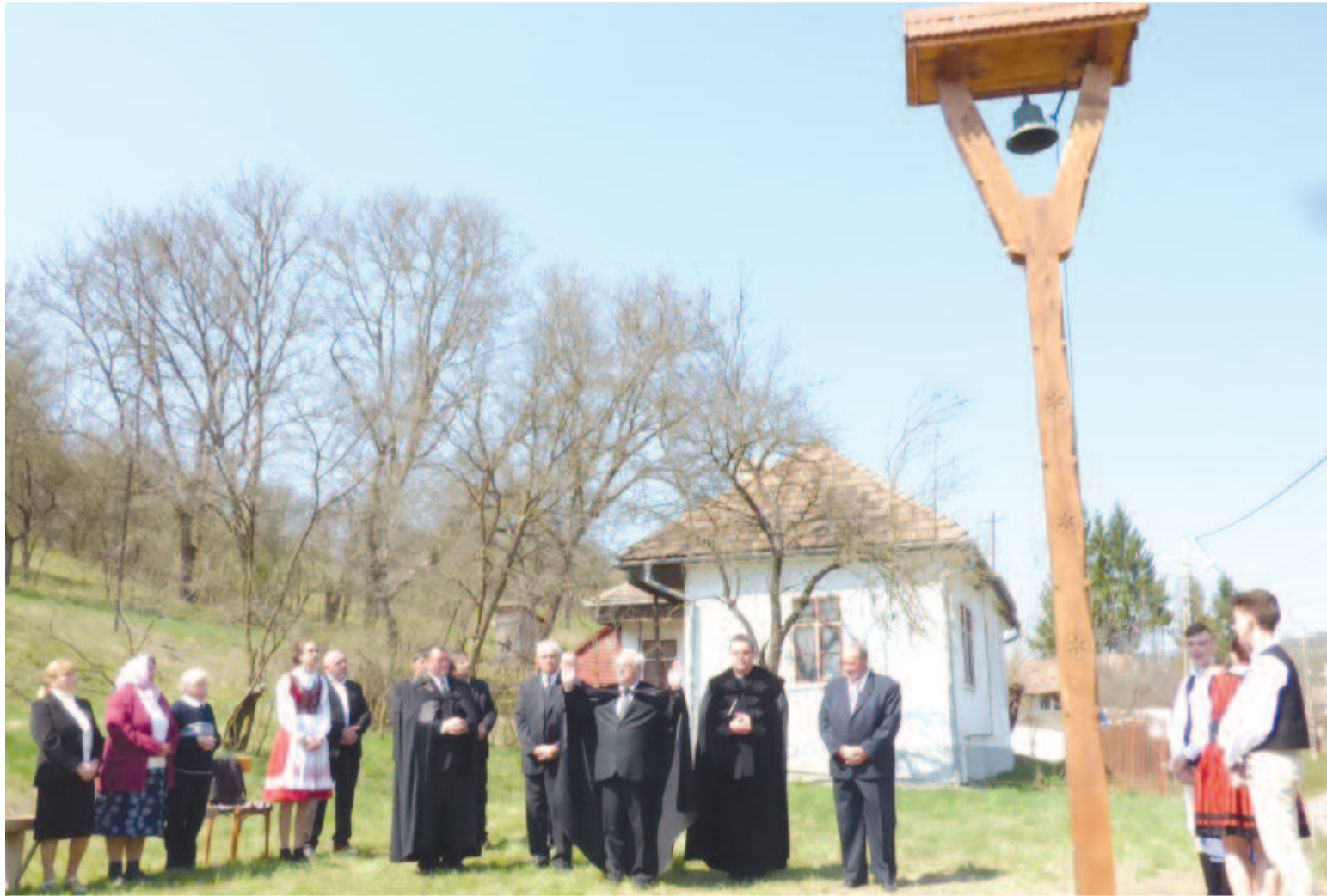
Ahol lehetőség van, a kültéri istentisztelet is szóba jöhet