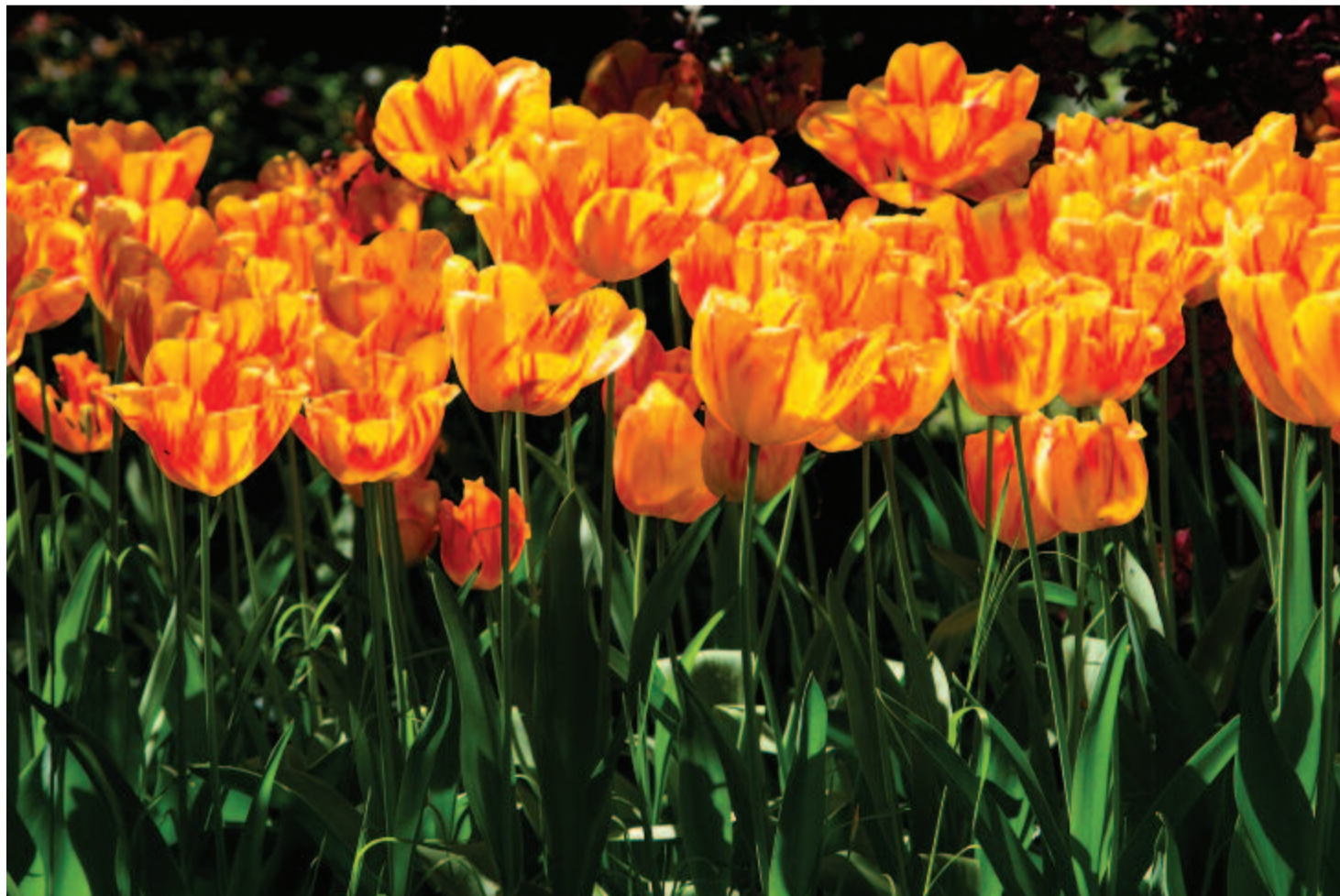
A dicsőségnek gyönyörű tulipányi mosolognak

Maradok kiváló tisztelettel. Kelt 2020-ban, Szent György napján