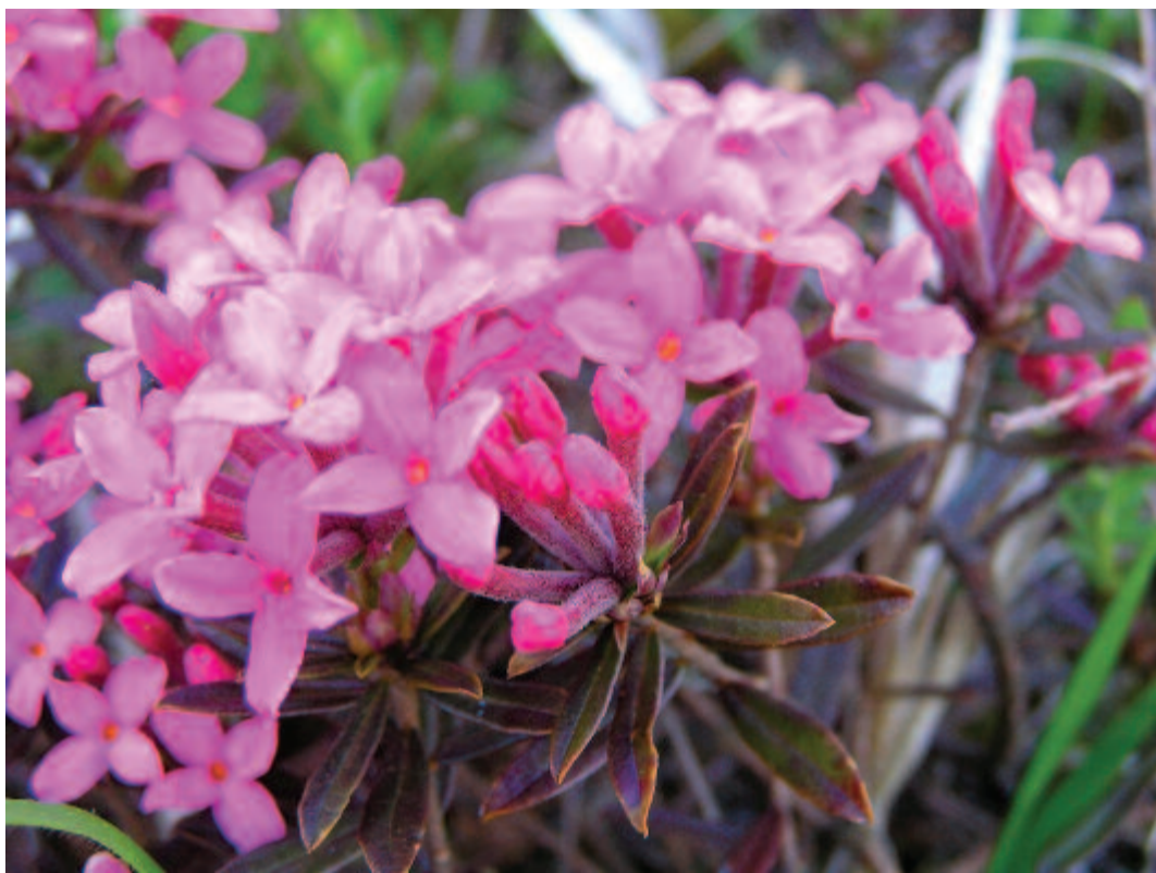
Daphne cneorum, henye boroszlán a Riszeg-tetőn

Tömjéne a tavasz a légben, virágos ágon kancsi fény ég. Kis, ideges lányok kacagnak, veri az ördög a feleségét.