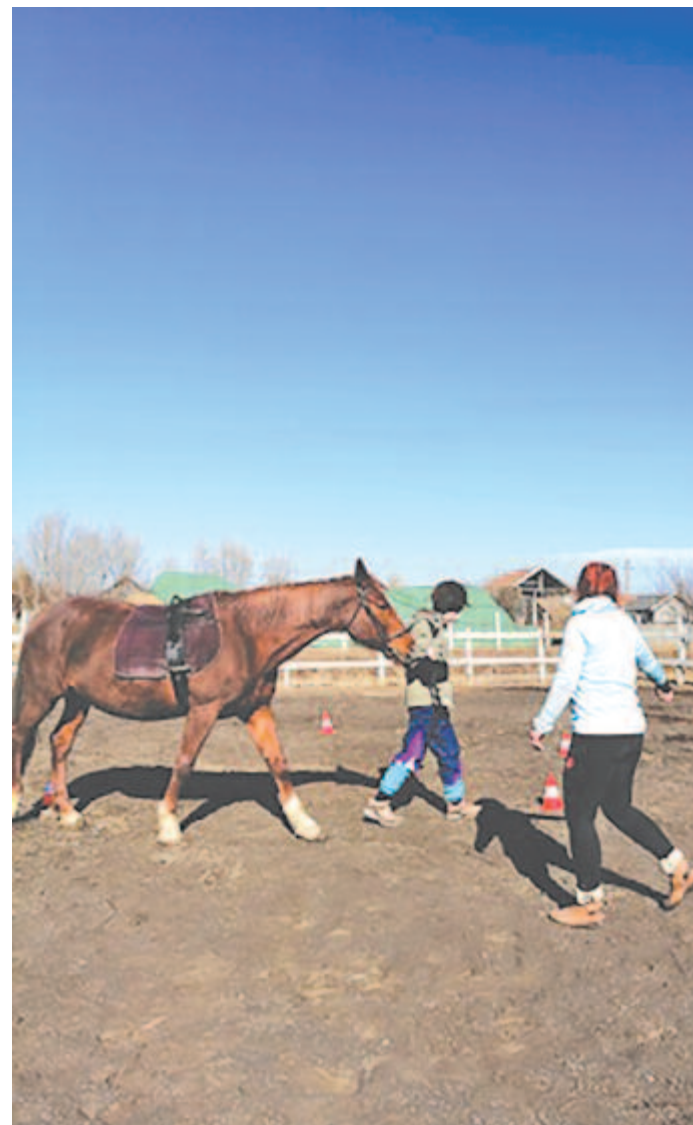
b) Érzelmi állapot, akarati-cselekvési képességek befolyásolása.

A gyógypedagógiai lovaglásban részt vevő gyermekeknek lehetőségük adódik érzelmeik kinyilvánítására. A jól végzett feladatok utáni elismerés, dicséret hozzájárul a gyerekek személyiségfejlesztéséhez.