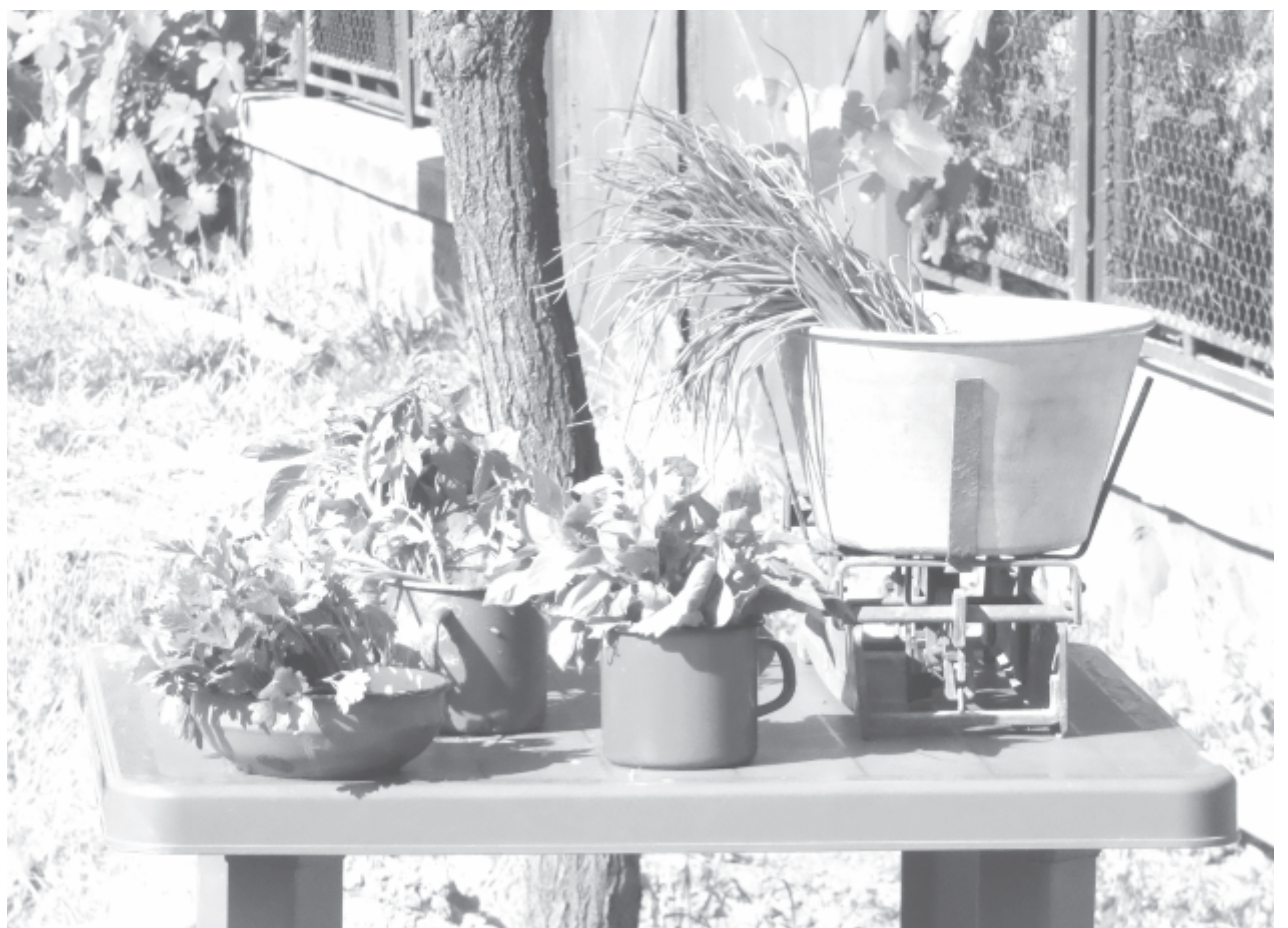
Idén már biztosan nem vihetik a palántát a korondi piacra, más lehetőség után kell nézniük