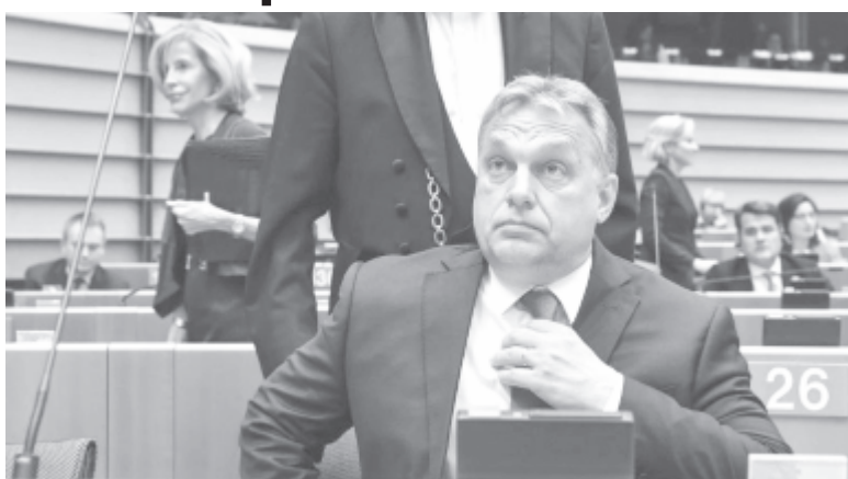
Orbán Brüsszelbe rendelték

Sassoli meghívását a magyar kormányfő elutasította azzal, hogy jelenleg minden erejét és energiáját a járvány elleni védekezés köti le, a magyar kormány képviselőjében Varga Judit igazságügyért és európai uniós ügyekért felelős miniszter