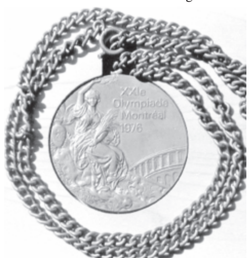
A montreali olimpián nyert bronzérem