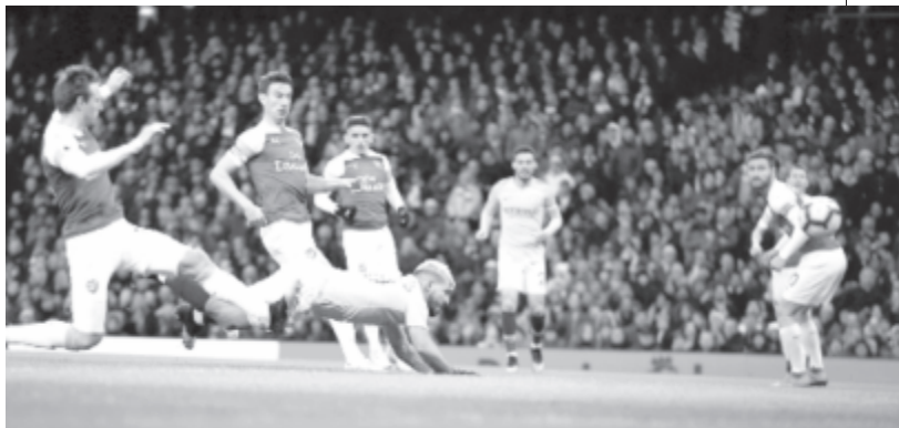
A Manchester City argentin csatára, Sergio Agüero szerint a játékosok félnek a fertőzésveszély miatt az újrakezdéstől.

* június 12.: a Premier League tervezett időpontja a bajnokság folytatására.