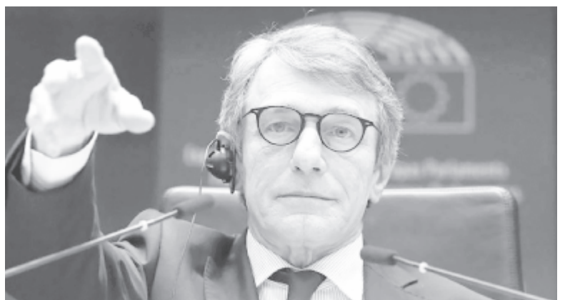
Sassoli „meghívása”