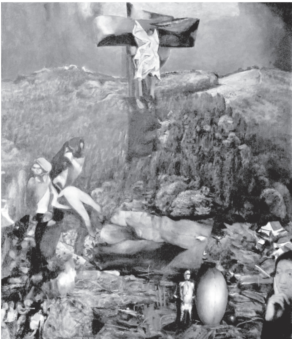
Új Golgota – olaj, vászon, 95x110cm, 2009. Mellékletünket Kákonyi Csilla festményeivel illusztráltuk