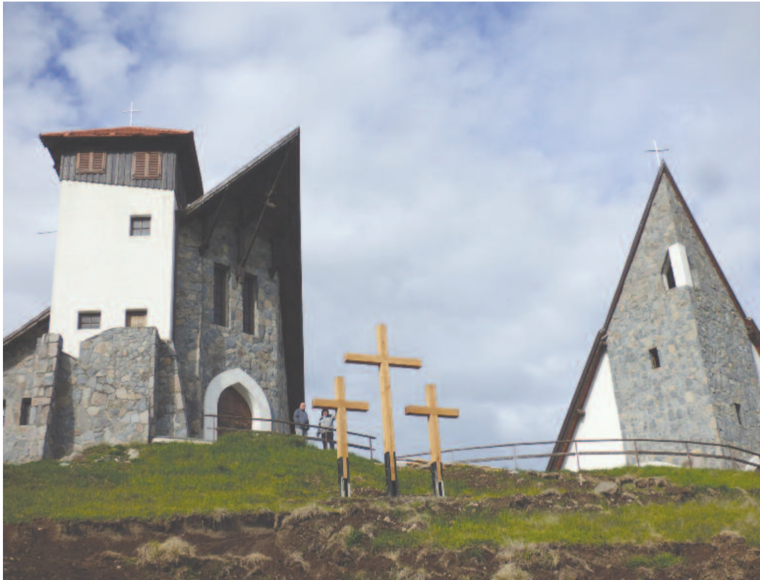
Évente két búcsút szerveznek a hegyen álló kápolnánál