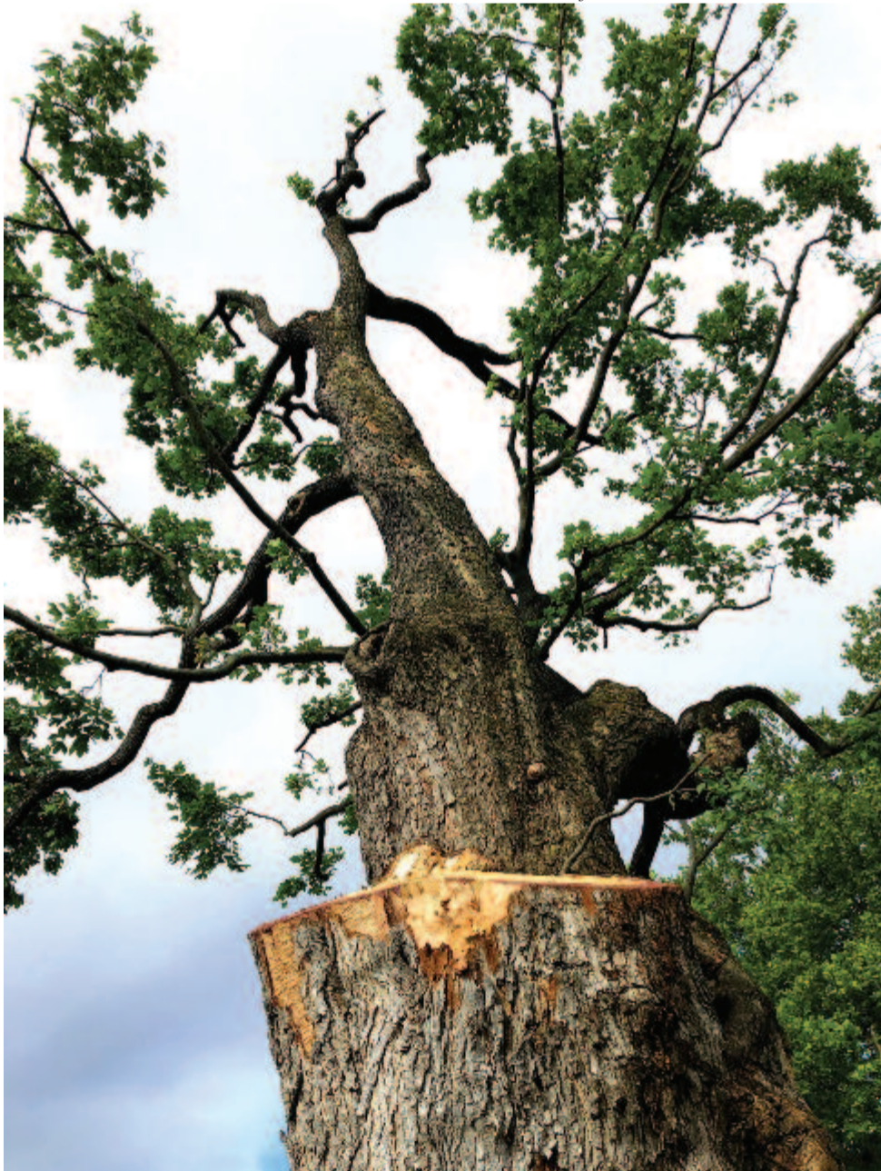
A vérvő csonkból virradó tavaszra új erdő sarjad győzedelmesen

Maradok kiváló tisztelettel. Kelt 2020-ban, Magdolna napján, pünkösöd előtt