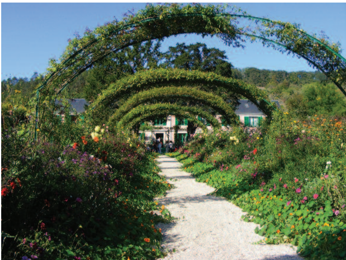
Monet háza és kertje

negyedóránként változik az időjárás, ömlik az eső, majd csepereg, azután gyönyörűen süt a nap.