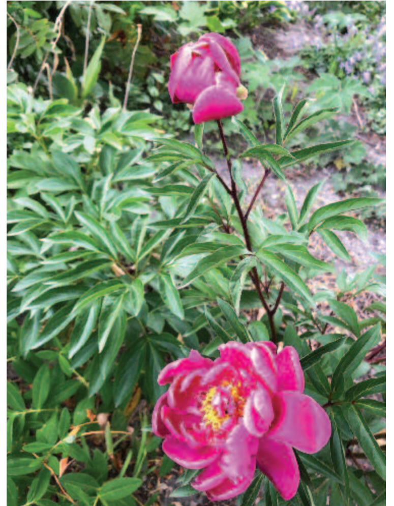
Két szál pünkösdrózsa kihajlott az útra

És békességes szót ejtett a szája, és békességgel várt az esztenája.