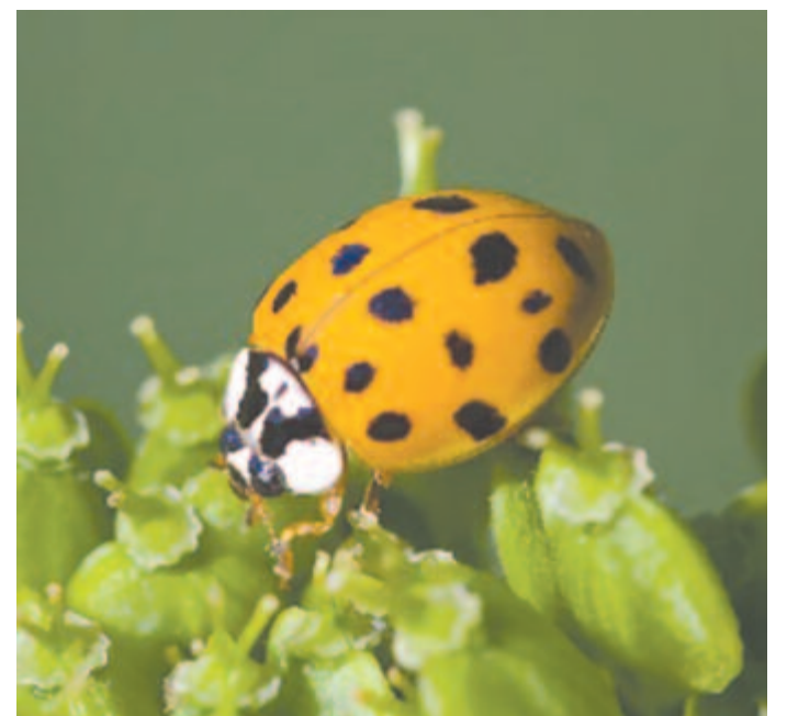
Harlekinkatica, más néven rémkatica

Népszerűségüknek köszönhetően mondák, dalok, versek, mesék születtek róluk, mesefilmek szereplőivé váltak. Anyanyelvünk gazdagsága a katicát becéző nevekben is