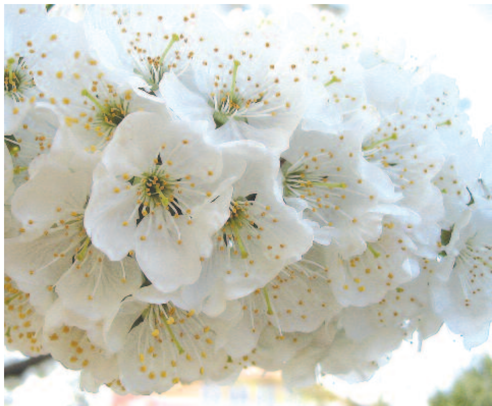
„Meggyfa: fehér menyasszony”

(...) veled karöltve Néztem az est csillagát, S lelkem, örömmel megtöltve, Itta Hébe poharát.