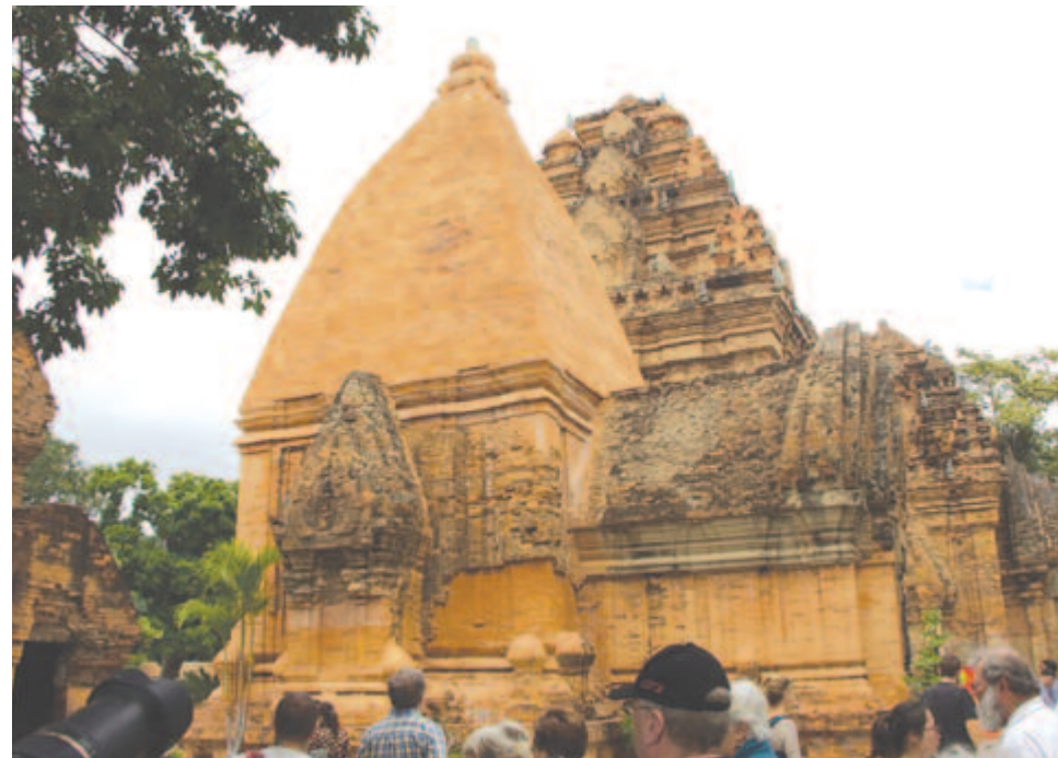
A Bo Nagat romjai