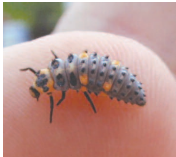
Katicalárva és a bábja

A hétpettyes katica veszélyeztetettségét fokozza a nemrég megjelent harlekinkatica ( Harmonia axyridis ), amely ugyancsak a katicabogarak családjába tartozó ragadozó bogár. Többnyire narancssárga szárnyfedőjén 15-21 fekete pont van. Kelet-Ázsiában őshonos. Az 1980-as években telepítették Nyugat-Európa egyes országaiba, mint Franciaország, Hollandia, Belgium, kísérleti jelleggel, a környezetkímélő technológiájú biológiai növényvédelem érdekében, mert nagyon hatékonyan pusztítja a levéltetveket. Onnan áterjedt Európa többi országába, így