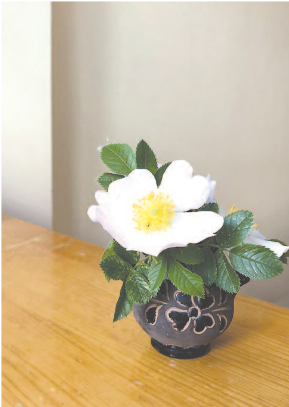
„Szedjük életünk virágját./ Most, mikor még illatoznak”

Kelt 2020-ban, az autonómia-aláírásgyűjtés utolsó napján