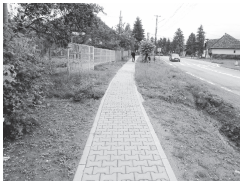
Teljes hosszában új járda szeli át a falut