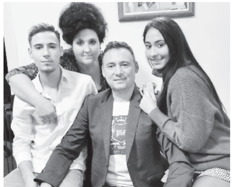
A koronavírus-járvány idején újra együtt lehetett a család