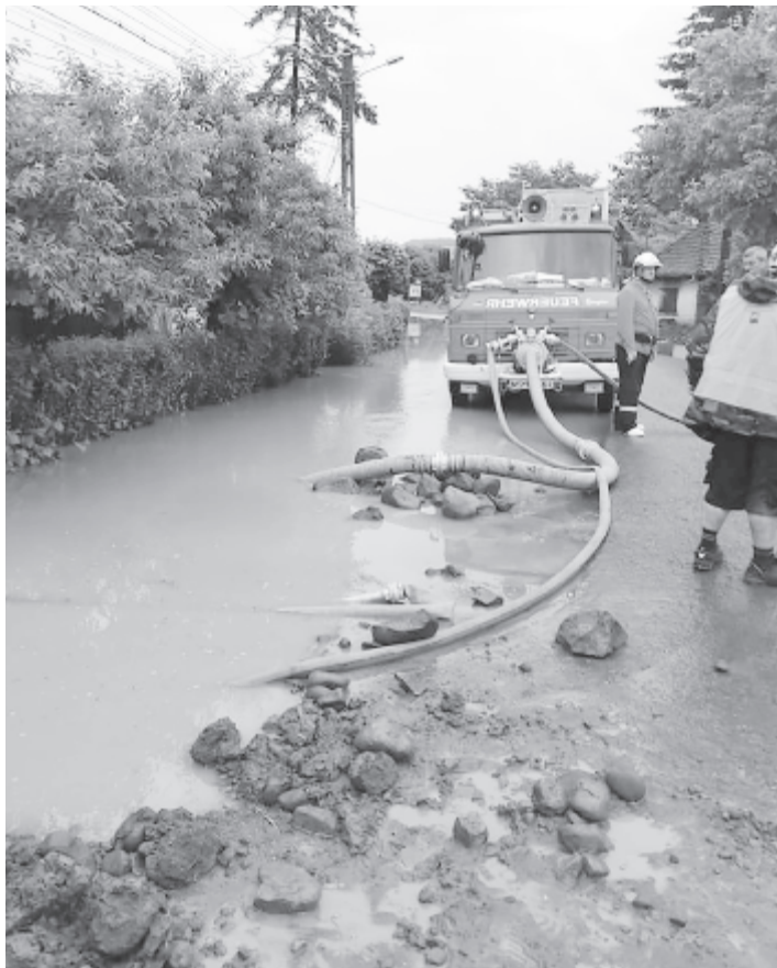
Nyárádköszvényesen a tűzoltók próbálták eltávolítani a felgyűlt vizet