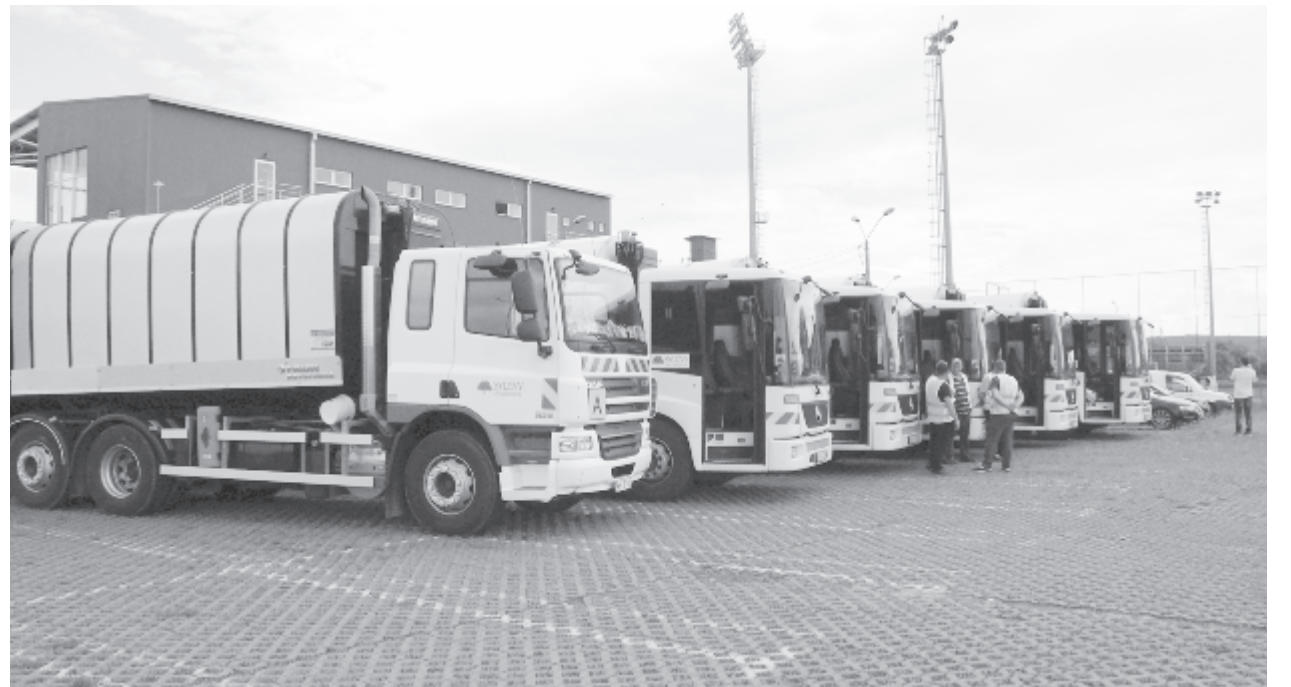
A Sylevy 27 szemetesautóval fogja ellátni a köztisztasági feladatokat

– Minden munkást szívesen látnak, a Sylevynél azonnal folytathatják a munkát. Akik dolgozni szeretnének és pénzt keresni, azok jelentkezzenek! – fogalmazott Trif Aurel. A marosvásárhelyiek azt remélik, hogy többé nem lesz szemetes a város, az új szolgáltató becsületes munkát végez, hogy tisztább és rendezettebb legyen a környezet.