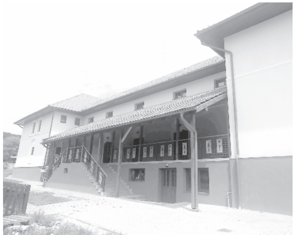
Kívül-belül megújult, impozáns épület várja a községet

A község többi művelődési otthona is rendben van – tette hozzá az előljáró: Hármasfaluban az elmúlt években tetőjavítás volt, rövidesen befejezik az épület külső szigetelését és külső-belső felújítását. A székelyabodi és szolokmai kultúrotthonokat is felújították az elmúlt négy évben.