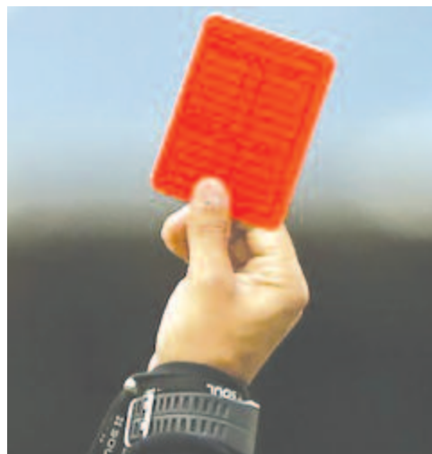
Az a csapat lesz előnyben, amelynek kevesebb mutatták fel a színes lapokat a játékvezetők. A piros lap három, a sárga egy büntetőpontot jelent majd.

Maros megye képviselője (amennyiben nem sikerül megszervezni időben a rájátszást a 4. ligában, akkor ez a Nyárád-tői Unirea lesz) a sorolás szerint a csoport második és harmadik mérkőzésén lesz érdekelt, miután ismeri a Sepsi OSK II és Szeben megye bajnoka közötti eredményt. A harmadik változat elfogadása esetén Maros képviselője hazai pályán kezdene Szeben megye bajnoka ellen, majd Sepsiszentgyörgyön játszana az OSK fiókcapatával. A meccsek sorrendje a másik két változat esetében sem változna.