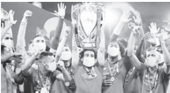
Az angol Premier Liga 1992 óta íródo történetében még nem volt bajnok a Liverpool, így a körülményeket is tekintetbe véve kétszeresen rendkívüli a most elnyert cím.

* Lionel Messi jövő nyáron lejáró szerződését 2023