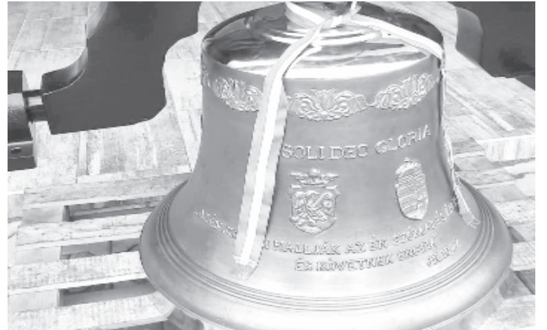
Nemzetiszín szalagokkal és csokrokkal ékesítették fel