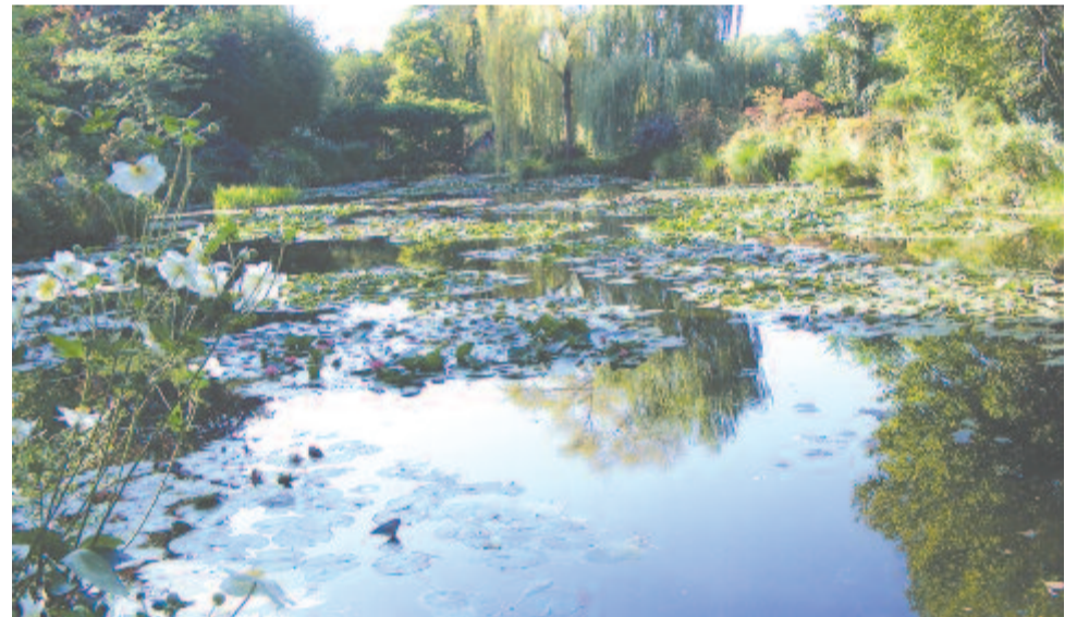
Tavorózsák Monet kertjében

Monet a 19. század végére hazája legünneltebb alkotójává vált, az átlagbér négyszázszorosát kereste, garázsa tele volt automobillal, első gyorsjáratú bűrságát 1904-ben kapta. Normandia, gyerekkorának színhelye, örök szerelme maradt. Az 1890-es évek elején többször felkereste Rouent, ahol az időjárástól függetlenül és minden napszakban a katedrálisat festette. Képei igazi témája