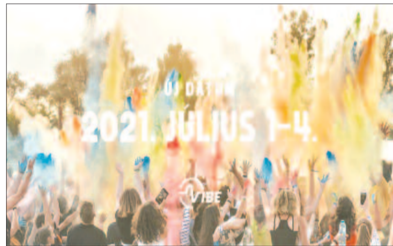
Az új időpont

– Szeretnénk, hogy aki az idén fellépett volna, az jövőben jöjjön el, ezt már el is kezdtük velük levelezni. De ez csak egy kiindulópont. Emellett még lett volna az idénre pár előadó, tehát a jövőre nézve még bővülni fog a fellépők listája, mások mellett nagy nemzetközi és magyarországi, illetve erdélyi nevekkel is.