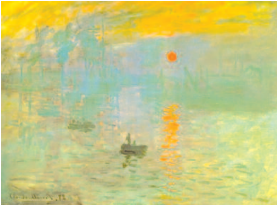
Monet: Impresszió, a felkelő nap