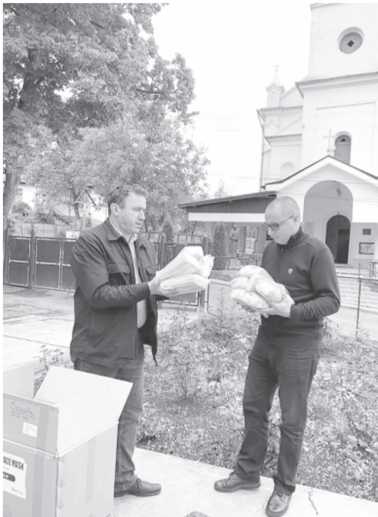
Folyamatosan zajlik a maszkok szétosztása a tanügyi és egészségügyi intézmények, egyházak és a szociális ellátásban részesülők között.

A jelképesen minden szovátai lakosnak egy-egy maszkot biztosító kezdeményezés gesztusértékű és becsülendő, a testvérkapcsolat és a nemzeti összetartozás jegyében valószínűleg meg, a budapesti közösség igazi „nagy testvér” módjára mutat utat és nyújt segítséget a nehéz időkben az erdélyi barátoknak. „Hálásak vagyunk, nagy segítség ez számunkra, köszönjük, hogy gondolnak ránk, és tesznek is ezért” – fogalmazott lapunknak az önkormányzat testvérkapcsolatokért felelős munkatársa, Kiss János. (gligor)