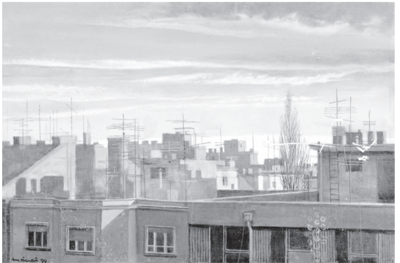
Mácsai István: Pesti hajnal

94 éve, 1926. június elsején született Újpesten a Kossuth- és József Attila-díjas költő, író, irodalomkritikus, műfordító, a nemzet művésze (elhunyt 2017 novemberében, 91 évesen).