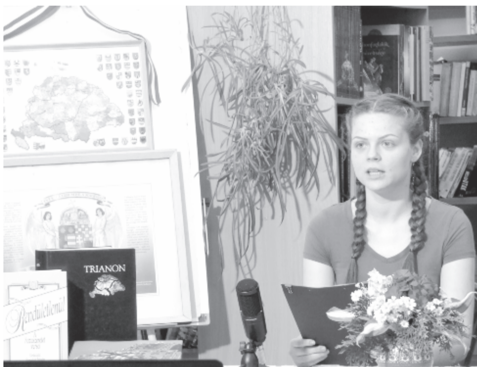
Százperces felolvasásra került sor a könyvtárban