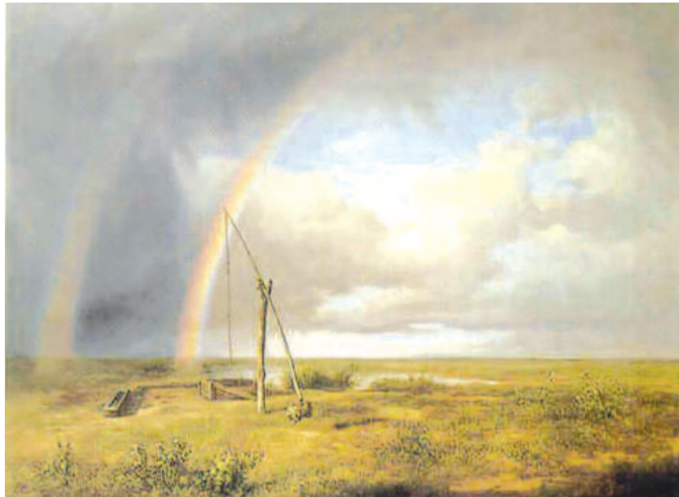
Markó Károly: A puszta szívárvánnyal

Nemzeti Galéria: Művészet otthonról), amelyeket a két intézmény közösségimédia-oldalain minden héten több mint 150 ezer egyedi felhasználó tekint meg.