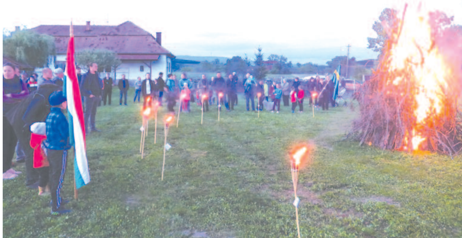
A nemzet határok fölötti – több mint ötezer helyen gyújtottak őrüzet a nagyvilágban