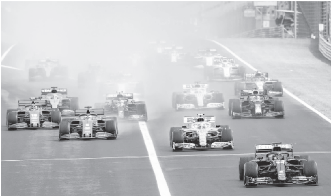
A start előtt egy órával még esett az eső a Hungaroringen, ezért a teljes mezőny az átmeneti, félig vizes, félig száraz aszfalra alkalmas gumikkal állt fel a rajtrácsra.

A Mercedes brit versenyzője, Lewis Hamilton nyerte meg a 35. Forma-1-es Magyar Nagydíjat – zárt kapuk mögött – vasárnap a Hungaroringen, ahol pályafutása során immár nyolcadik alkalommal diadalmaszkodott.