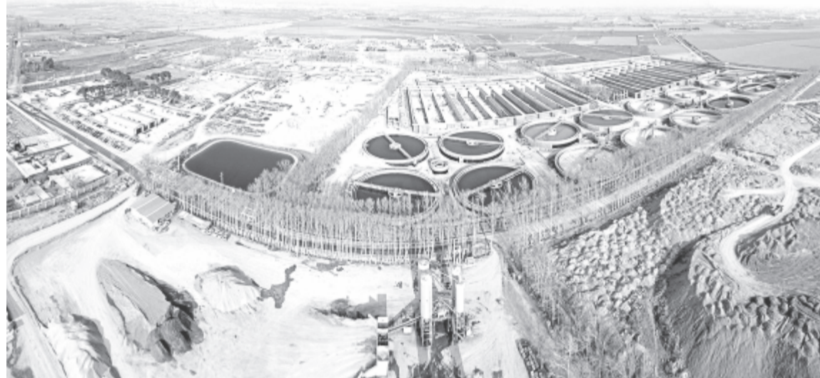
Épülő szennyvíztisztító telep. A kép illusztráció.

* Melinda Simon-Vasarhelyi, Vasile Mircea Cristea, Alexandra Veronica Luca (2020): Reducing energy costs of the wastewater treatment plant by improved scheduling of the periodic influent load. Journal of Environmental Management 262 (2020) 110294. DOI: https://doi.org/10.1016/j.jenvman.2020.110294