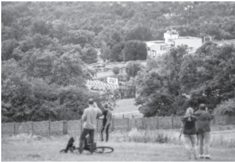
Szurkolók figyelik a Forma-1-es autós gyorsasági világbajnokság Magyar Nagydíjának futamát Magyar Nagydíjon, a Hungaroring melletti dombról. A versenyt a koronavírus-járvány miatt zárt kapuk mögött tartották.

A szezon két hét múlva Nagy-Britanniában folytatódik.