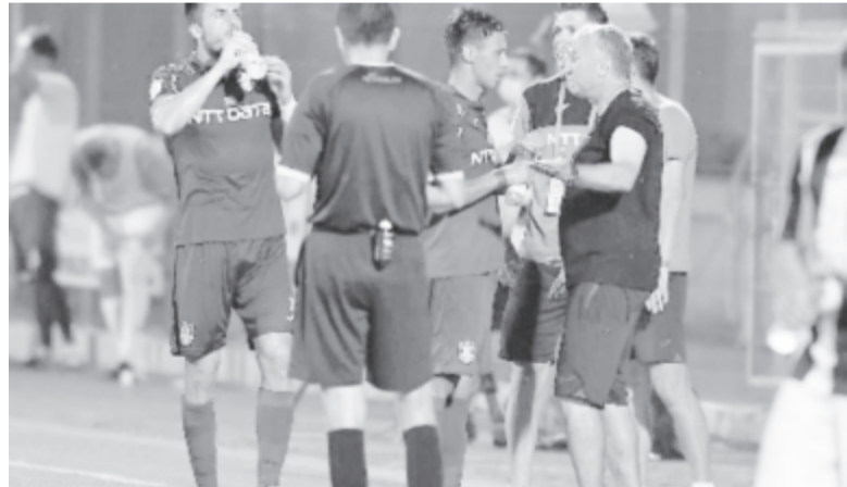
A bajnoki címvédőnél nagy az aggodalom: a zöldasztal mellett dönthetnek az aranyéremről?

A bajnokságot szervező Hivatásos Labdarúgók Liga (LPF) szerint augusztus 3-ig kell befejezni a pontvadászatot, de remélik, hogy az Európai Labdarúgó-szövetség (UEFA) Románia esetében kivételt tesz, és meghosszabbítja ezt a határidőt, a kialakult helyzetre való tekintettel.