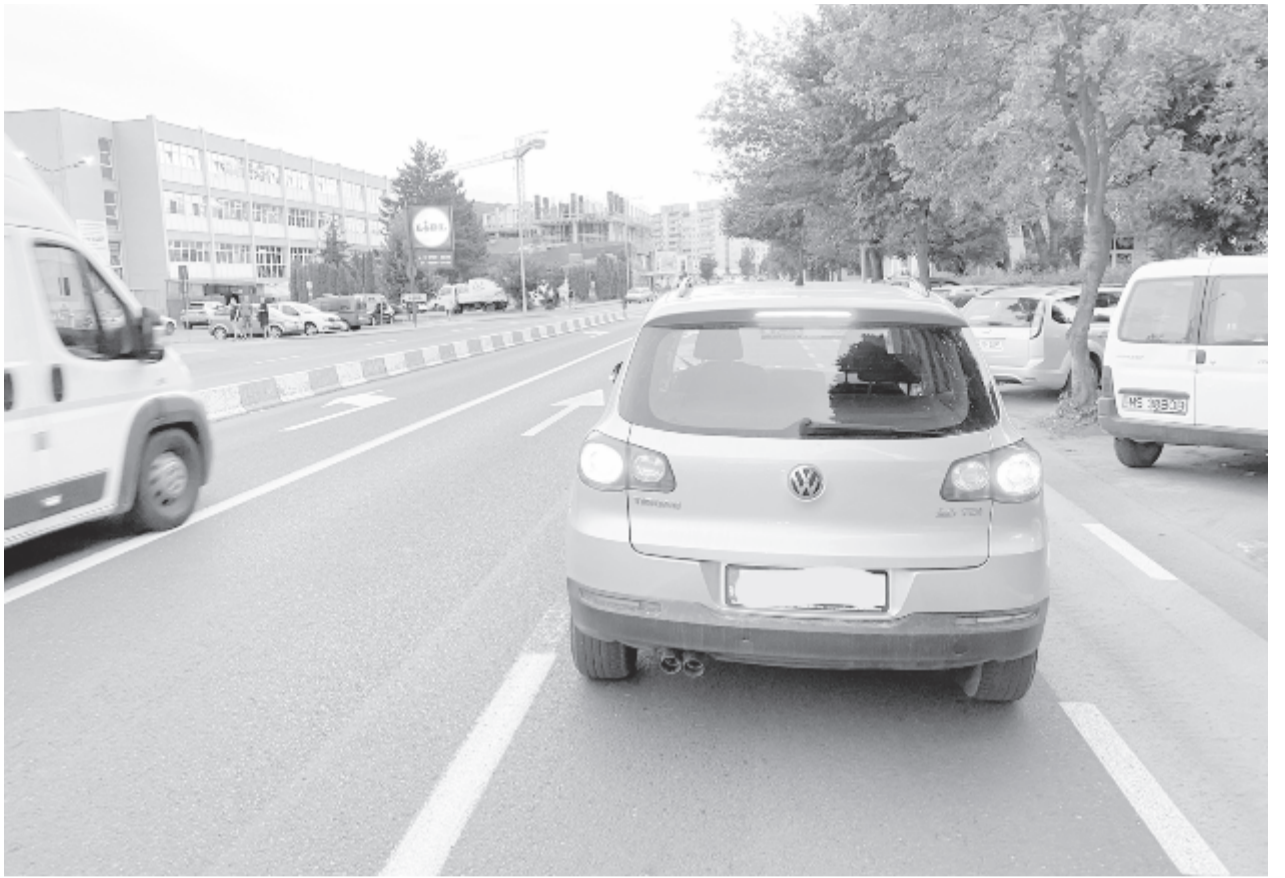
Pont befér az autó, ha meg van állva

Már jó pár éve kéri a különböző civil szervezetek és a biciklivel közlekedők a kerékpárutat Marosvásárhelyen. Most lett. Igaz, ilyenre senki nem számított.