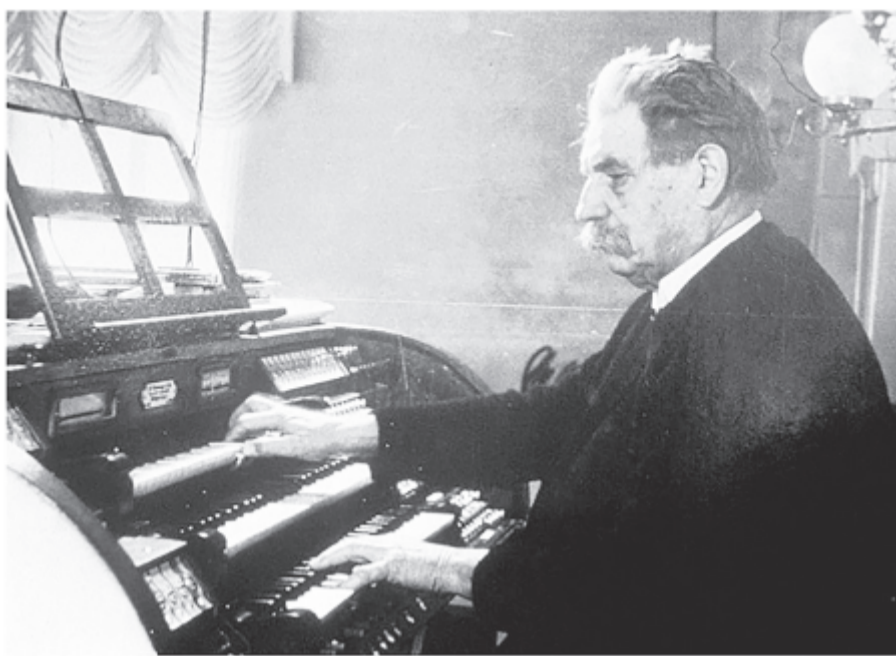
Albert Schweitzer az orgonánál

Párizsi orgonatanulmányai kapcsán észrevette, hogy nagy a tanácsatlanság Bach zenéjének a helyes előadása körül. Kellően felkészültnek érezte magát arra, hogy tanulmányt írjon Bach művészetéről. Azt hitte, megússza egy tanulmánnyal. A végeredmény az lett, hogy amint főlvázolta magában a témát, már könyvterjedelműnek mutatkozott a tanulmány. Szerencsésnek mondhatta magát, mert egy strasbourgi zeneműkereskedőtől megtudta, hogy egy tehetős gazdag hölgy túladna teljes Bach-kiadványain. Így végül az értékes kiadványt neveltségnek számító összegért szerezte meg.