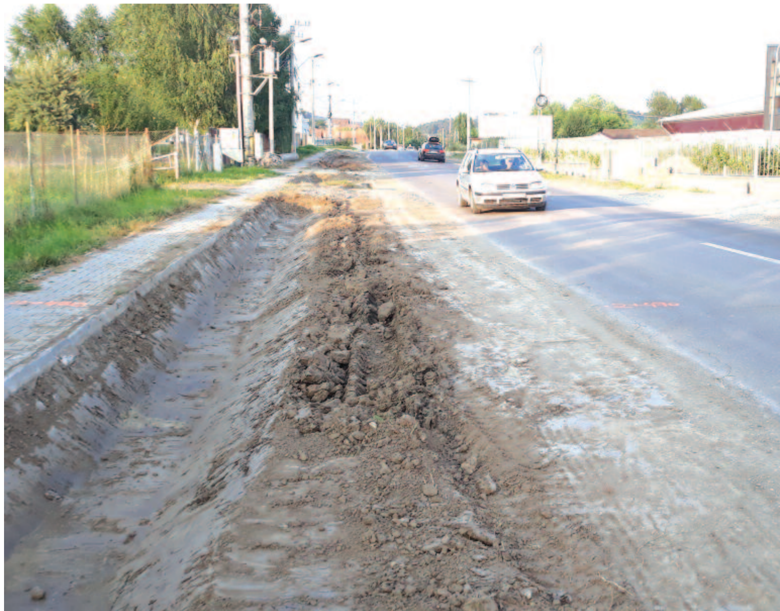
Az útpadkát leaszfaltozzák, a sáncokat kibetonozzák