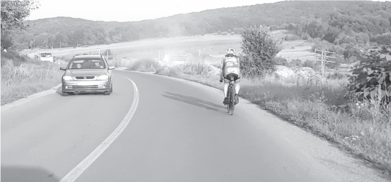
A kerékpárosok kedvelt szakasza lett a 135-ös út, ezért biztonságosabbá kell tenni

A jeddi út esetében a cél az úttest szélesítése és megerősítése. Ez azt jelenti, hogy rendezik és szélesítik az útpadkát, és mindkét oldalon leaszfaltozzák 8,4 kilométer hosszúságban. Emellett rendezik az útkereszteződések, kiegyenlítik a kereszteződésekben az utak közötti szintkülönbséget. Ahol az út mellett sánc van, kibetonozzák azt. Fontos megjegyezni, hogy az utat, pontosabban az út falát sok helyen meg kell erősíteni, erre a célra helyenként külön merevítőket kell beépíteni, ez teszi költségessé a munkálatot. A padkát csak az út megerősítése után lehet leaszfaltozni, és a jelenleg hat méter széles út hét és fél méteres lesz. A munkálatok összköltsége 12 millió lej, a kivitelezési idő 44 hónap. Az idei évre a megyei költségvetésben másfél millió lejt különítettek el erre – tudtuk meg a megyei tanács sajtóirodájának munkatársától. Ami az úttest további szélesítéseit illeti az útkereszteződésekkel, Lukács Katalin elmondta: végül nem került bele a projektbe, mert nincs a megyei tanács tulajdonában az ehhez szükséges, megfelelő szélességű telek. Az utat csak akkor lehetne pluszsávval bővíteni, ha kisajátítanának területeket, de ez sok esetben nagyon problémás, mert az út településen halad át, és a kerítések olykor leérnek az útig, a sáncig.