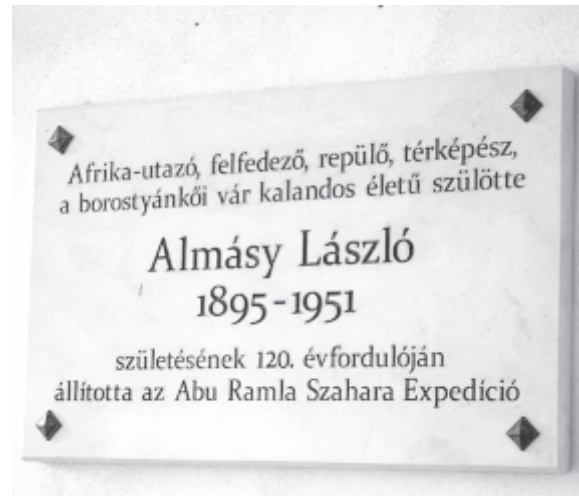
Születésének 120. évfordulója alkalmából a borostyánkői (bernsteini) várban magyar nyelvű emléktáblát avattak