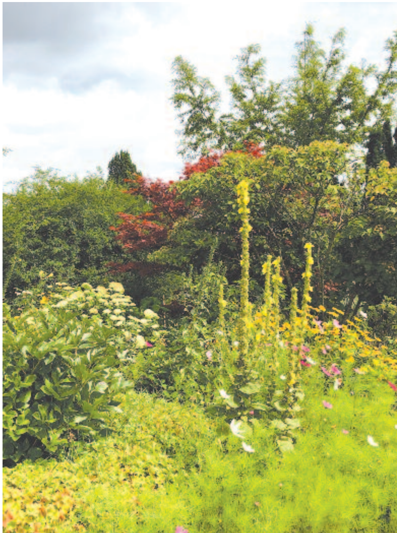
Borostyánkő várkertje 2020 augusztusában

Kelt 2020-ban, augusztus harmadik dekádjának elején