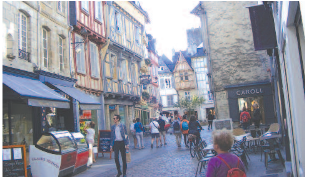
Kemper – utcaképlet

közéletben, megalapították az úgynevezett DIWAN intézményeket, amelyek a breton nyelv tanítására szakosodtak. Megjelent a breton nyelvű média is (rádió, televízió, újságok).