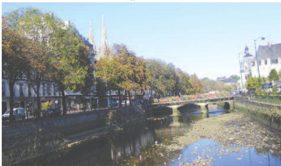
Viragos híd az Odet fölött