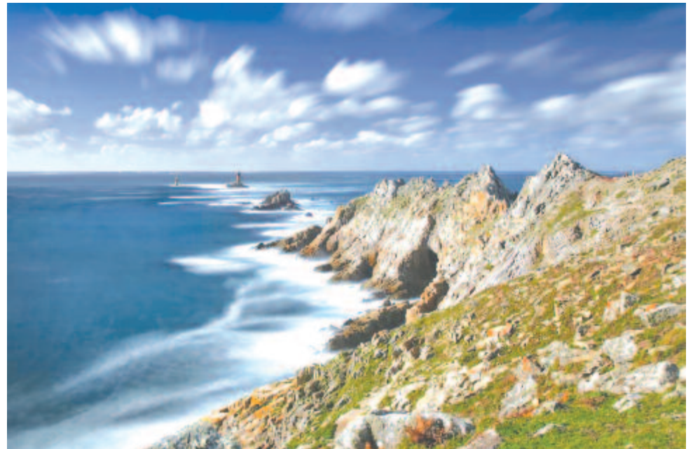
Pointe du Raz

Az óceán melletti hosszabb úton térünk vissza a ránk várakozó autóbushoz és aztán a kemperi szálláshelyünkre.