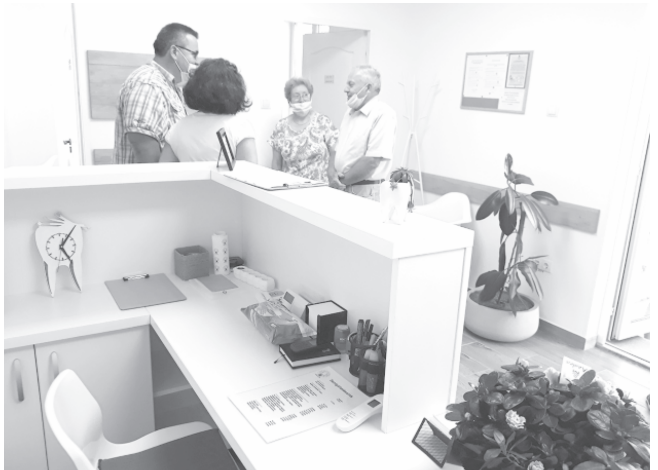
A helyiek örömmel, jóindulattal fogadták az új szolgáltatást és a kellemes környezetet