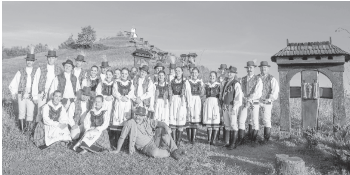
A székelyvéckei kálvária alatt

több mint 40 táncos van. Beosztjuk a munkát, mindenkinek van feladata. Ehhez hozzájön még a videófelvételeink utómunkálata is. Dolgozunk és abban reménykedünk, hogy az intézményt nem zárják be. Ha odafigyelünk egymásra, betartjuk az előírásokat, óvatosak vagyunk, átvészeltük ezt az időszakot. Az együttest eddig nem nagyon érintette a betegség. Az év folyamán a román tagozatról három, míg a magyarról egy kolléga fertőződött meg, és otthoni ápolásra szorultak. Ha valakinél gyanús tünetek jelentkeztek, akkor a döntésem alapján otthon maradtak még akkor is, ha utólag kiderült, hogy csupán meghűltek. Számunkra a táncok, az irodai és az adminisztratív személyzet és a zenészek, valamint mindannyiuk családjának a biztonsága fontos. Ebben az időszakban arra készülünk előadásainkkal, a táncokkal, hogy amikor lejár a veszélyhelyzet, visszanyerjük a járvány ideje alatt lemorzsolódott közönségünket. Reméljük, hogy előadásaink szépsége, változatosága visszacsalja majd nézőinket a terembe akkor, amikor már lehet megfelelő körülmények között fogadni a közönséget.