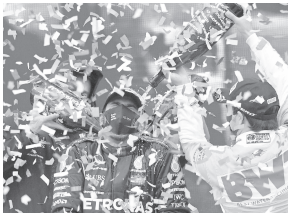
A mexikói Sergio Perez (j) pezsgővel locsolja Lewis Hamiltont a Forma-1-es Török Nagydíj dobogóján

A 34. körben Vettel, majd a 37. körben az élről Stroll kiállt a boksza kerékcseréjére, Hamilton pedig a 38. körben megelőzte a veze-