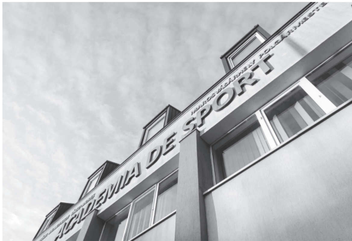
Miközben a városi sportklub a Siletinától bérelte az irodákat és a tenispályákat, a víkendtelepi létesítményeket a Turism Kft. ügykezelésébe adták

gébe tartozó Maros Sportklub maradna az átadás előtt álló fedett uszoda és a fedett jégpálya üzemeltetője. A fedett uszodát előreláthatólag márciusban átadják, és a város egyfajta együttműködési rendszert alakít ki a Maros Sportklubbal, mert egyedül nem tudja majd kitermelni a működtetési költségeket. A város