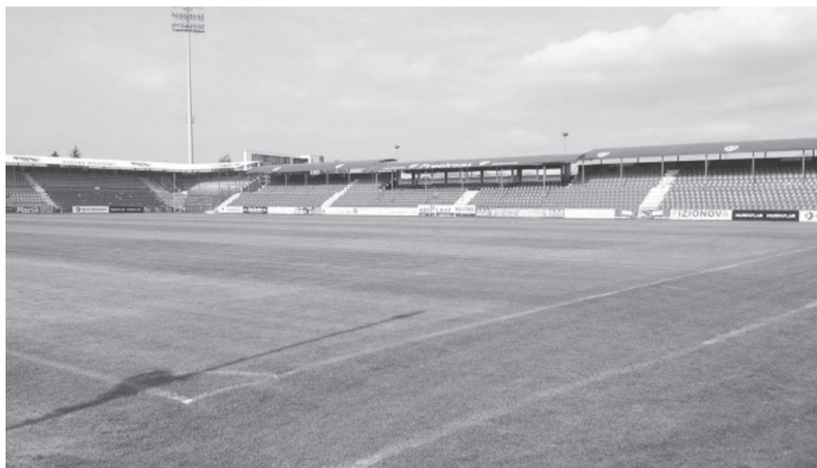
Felszólítják a Transil-stadion tulajdonló magántársaságot, hogy „takarítsa el a város területéről ezt a nagyon rossz minőségű építményt, amely használhatatlan és lassan életveszélyes”

(Az interjú befejező részét holnap számunkban közöljük.)