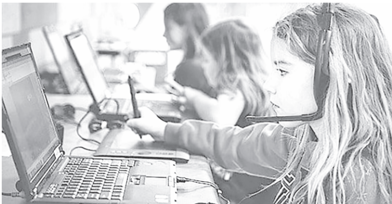
Online órák, illusztráció

szakot mégis csak egy kicsit az osztályközösség szempontjából intenzívvé tenni. Arra jutottunk, hogy meg kell próbálnunk bizonyos tevékenységeket az online térben végezni közösen, például a közös mézeskalácssütést meg lehet tenni úgy, hogy mindenki süt otthon, és közösen megbeszéljük vagy együtt teázunk a kamera előtt. Nyilván ez mesterséges, és szerintem nem helyettesíti azt az együttlétet, ami ilyenkor lenni szokott.