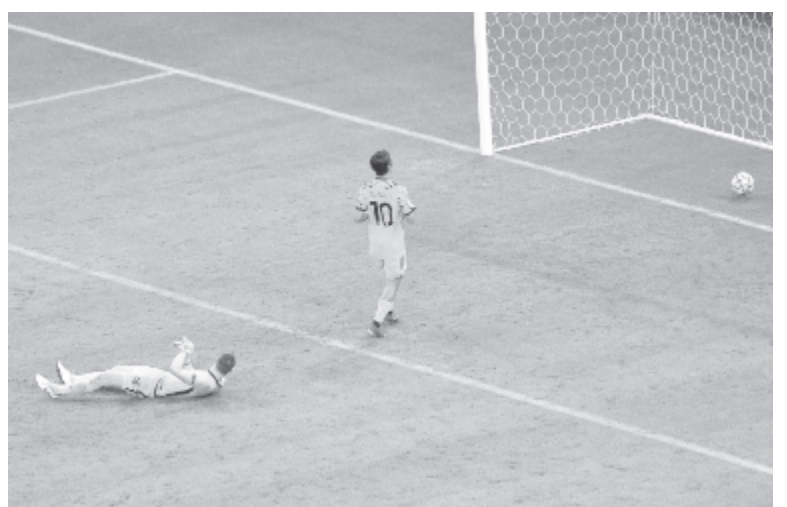
A Fradira egyáltalán nem jellemző koncentrációs hibákat ezúttal mellőznék... Budapestén jószerevel két gólt ajándékba kapott a Juventus: a képen az egyik ilyen találat, Paulo Dybala szerzeménye

A csoport állása: 1. Manchester United 6 pont (8-3), 2. RB Lipcse 6 (4-6), 3. Paris Saint-Germain 3 (4-4), 4. Basaksehir 3 (2-5).