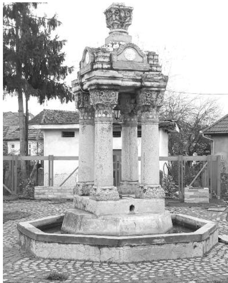
Sokan használják a két csorgó vizét

A polgármester ennek kapcsán megjegyezte: „Vásárhely fejlesztéséhez a szeptemberi választásokon megtettük az első lépést. Ahhoz viszont, hogy ügyünket győzelemre vigyük, Bukarestben is szövetségeseink kell legyenek. A következő években ilyen eredményeket csak akkor fogunk tudni elérni, ha van kivel és van ahol tárgyalásokat folytatni. Ezért nem szabad hátrádnunk a szeptemberi győzelem után. Ott kell lennünk december 6-án is, hogy a következő négy évben legyen egy erős képviselőnk, amelyik Bukarestből segíti városunk fejlődését.” (közlemény)